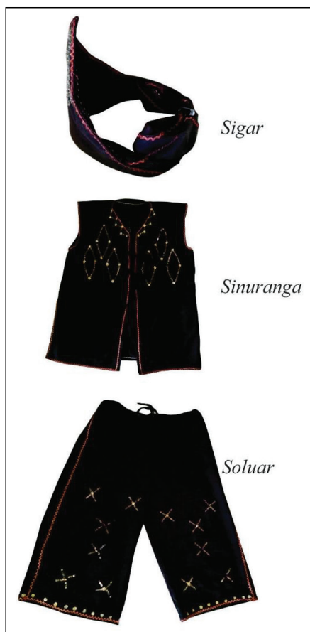
Rajah 2 Struktur sinuranga

Rajah 2 menunjukkan struktur sinuranga yang dapat dibahagikan kepada tiga bahagian, iaitu hiasan kepala ( sigar ), pakaian atas baju ( sinuranga ) dan pakaian bawah seluar ( soluar ). Bahan untuk menghasilkan sinuranga pada masa dahulu adalah menggunakan bahan alam, iaitu benang daripada urat daun nanas atau lamba untuk dijadikan kain. Lamba tersebut diwarnakan dengan menggunakan bahan alam yang dipanggil tahum . Proses menghasilkan lamba adalah sangat rumit dan memerlukan kesabaran yang tinggi. Kemunculan kain baldu dan kain kapas yang dijual oleh pedagang-pedagang dari China telah menggantikan lamba yang sukar dihasilkan. Walau bagaimanapun, identiti asal sinuranga masih dikekalkan melalui reka bentuk yang dihasilkan. Berikut merupakan struktur busana sinuranga .