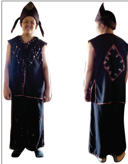
Rajah 1 Reka bentuk Sinuranga

Sinuranga adalah panggilan kepada pakaian tradisional lelaki Dusun Tindal yang dipadankan dengan pakaian rinagang . Pola pakaian sinuranga menggunakan beberapa aksesori yang dipadankan dengan baju ( sinuranga ), seluar ( soluar ) dan tengkolok ( sigar ). Warna kain atau binidang 4 biasanya didominasi dengan warna hitam dan disulam dengan manik serta benang berwarna merah. Hasil sulaman pula memaparkan variasi motif yang berbentuk geometri seperti segi tiga dan segi empat.