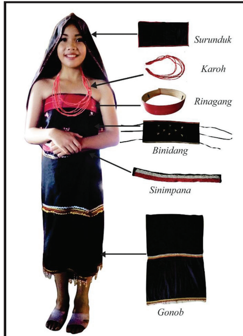
Rajah 3 Struktur rinagang