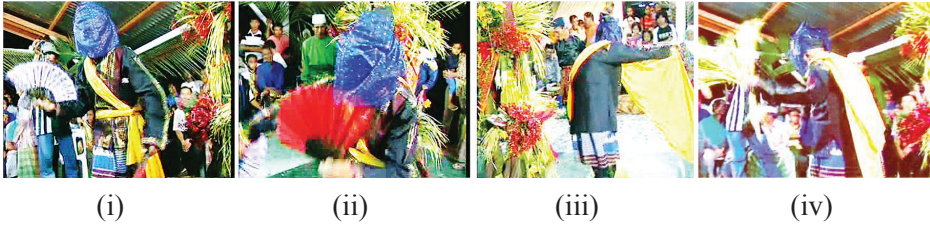
Rajah 2 Gerak tari tarian sayau babalian menerusi gerakan tangan selendang kuning, kipas tangan dan mayang pinang

Pergerakan sayau babalian yang merujuk gerak tari tangan dan gerak tari menggunakan aksesori selendang kuning, kipas dan mayang pinang [Rajah 2 (i) hingga (iv)]. Gerak tari ini diadaptasi daripada alam seperti gerak tangan burung terbang, sulur menolak angin dan pergerakan gajah lambung belali. Unsur-unsur spiritual dalam gerakan tari ini ialah memanggil makhluk halus turun ke bumi dengan menggunakan selendang berwarna kuning [Rajah 2 (iii)]. Unsur perlambangan warna kuning mewakili kumpulan makhluk halus. Gerak tangan menggunakan kipas berwarna merah dan biru pula menunjukkan babalian yang sedang berunding dengan makhluk halus. Kipas berwarna merah dan biru melambangkan dua kumpulan makhluk halus yang turun bersama babalian semasa pengubatan berlangsung. Makhluk harus ini menari bersama babalian mengelilingi sangkuban . Sangkuban adalah tempat tinggal sementara makhluk halus sebelum dihantar ke tempat asalnya. Babalian juga menari dengan gerak tangannya sambil memegang mayang pinang [Rajah 2 (iv)]. Mayang pinang dipercayai disukai oleh makhluk halus. Pada masa ini, babalian akan berkomunikasi menggunakan bahasa makhluk untuk mencapai perundingan agar semangat pesakit dapat dikembalikan.