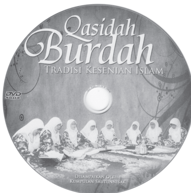
Rajah 2 Kulit DVD