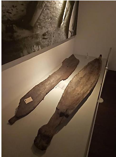
Foto 3 Artifak keranda perahu yang dipamerkan di Muzium Sarawak, Kuching memperlihatkan ciri-ciri kebudayaan

Dalam sebuah dokumentari oleh BBC Documentary: How Art Made the World 2 of 5 - The Day Pictures Were Born (20 Julai 2015) menjelaskan lukisan yang dijumpai pada dinding dan siling gua ini lazimnya bersubjekkan haiwan buruan yang besar seperti bison 3 , mammoth , kambing gurun dan kuda. Selain itu, binatang kecil seperti burung, ikan dan sebagainya terdapat juga sebagai subjek lukisan mereka. Satu perkara yang menarik ialah figura lelaki dalam karya lukisan ini sentiasa ada. Menurut kajian, figura lelaki ini ialah shaman 4 bagi satu-satu kumpulan itu. Sebuah lukisan pada dinding gua telah ditemui di Perancis dan Sepanyol Utara pada lebih kurang 120 tahun yang lalu. Penemuan tersebut membuktikan masyarakat seawal 35, 000 tahun Sebelum Masihi lagi telah menggunakan lukisan, imej, lambang dan simbol. Selain itu, di empat tempat di Asia dan Afrika telah ditemui pelbagai artifak peninggalan sejarah yang membuktikan bahawa kesenian itu telah lahir dalam zaman prasejarah (Tansey & Kleiner, 1996).