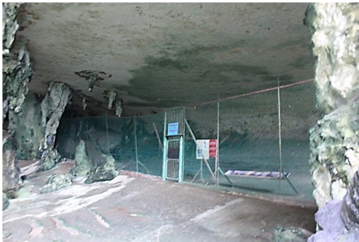
Foto 2 Panel dinding lukisan gua di sebalik pagar yang bertujuan melindunginya daripada diceroboh dan aktiviti vandalisme

Tindakan pihak Muzium Sarawak menjadi isu yang dipandang baik. Namun, ada sesetengah pihak yang tidak berpuas hati kerana tidak dapat melihat kawasan lukisan gua tersebut dengan lebih dekat. Keadaan ini makin parah apabila menjejaskan jumlah pengunjung yang datang melawat ke gua tersebut. Oleh itu, penyelidikan ini diharapkan sedikit sebanyak dapat membantu dalam aspek pengurusan dan dokumentasi imej dan motif lukisan gua tersebut.