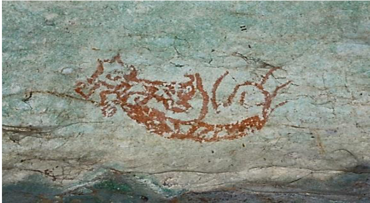
Foto 9 Imej ‘perahu maut’ yang ikonik dalam keseluruhan panel lukisan gua pada Gua Kain Hitam ( The Painted Cave )

Foto 9 menunjukkan satu imej perahu yang memiliki ciri-ciri yang disebut oleh Tom Harrison ‘ emerging tree ’ dari dasar perahu. Imej dihasilkan menggunakan unsur garisan yang tebal dan unsur rupa yang kompleks. Setiap garisan yang dibentuk adalah dinamik dan memberi gambaran dimensi pergolakan dalam imej ini. Aspek yang ditekankan dalam mencipta semula imej ini adalah dengan mengenal pasti ciri-ciri utama imej, iaitu kepelbagaian jenis garisan yang diaplikasikan untuk mendapatkan rupa yang dinamik.