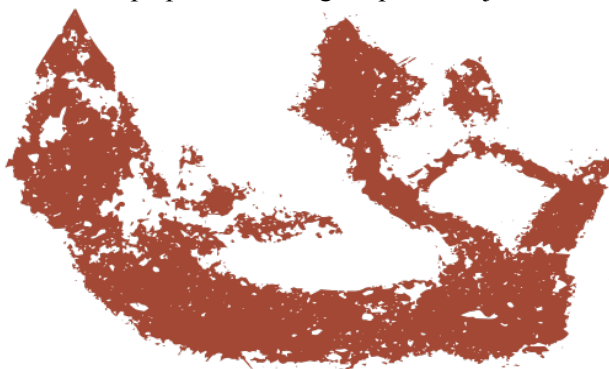
Foto 12 Aplikasi unsur garisan tebal kelihatan jelas menghasilkan rupa perahu dan figura pada imej

Dalam usaha awal penyelidikan terhadap Gua Kain Hitam ( The Painted Cave ), imej pada dinding gua tersebut hanya bersifat hiasan dan cuma sedikit rekod penulisan yang ditemui berhubung lukisan gua tersebut. Malahan, rekod awal lakaran oleh Paul Kerek dalam penulisan Szabó, Piper dan Barker juga tidak dapat dikenal pasti keberadaannya. Walhal, rekod tersebut adalah sangat