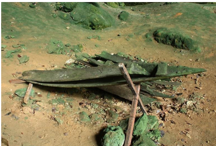
Foto 7 Beberapa susunan kayu yang merupakan ‘keranda perahu’ yang menempatkan mayat masyarakat purba sekitar 3,000 tahun dahulu