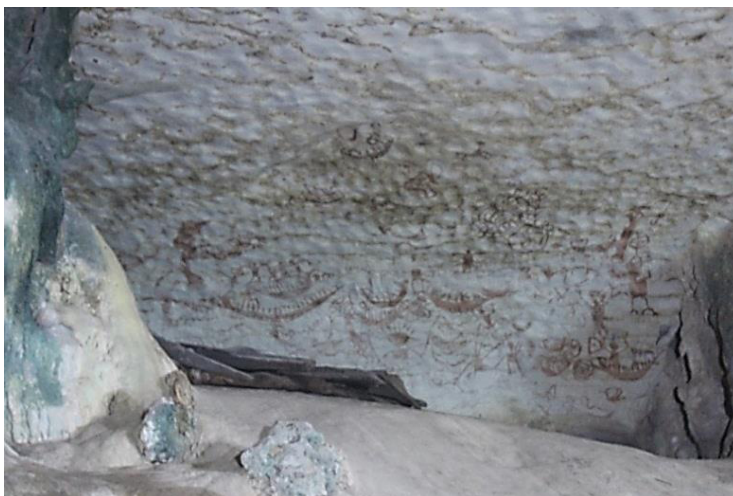
Foto 5 Panel pertama dinding lukisan gua dan beberapa susunan kayu yang merupakan ‘keranda perahu’

Pada panel pertama, lukisan gua tersebut adalah masih jelas dan rupa serta bentuk imej secara keseluruhan boleh dikenal pasti. Panel kedua pula, imej yang terdapat pada dinding gua adalah pudar. Setiap imej masih kelihatan baik namun ciri-ciri yang jelas pada sesetengah imej tidak dapat dikenal pasti. Panel ketiga adalah bahagian yang paling terjejas kerana imej sudah tidak kelihatan dengan jelas. Keadaan lukisan gua yang sangat pudar menyukarkan aktiviti mengenal pasti imej yang telah dihasilkan. Panel keempat juga mengalami situasi yang sama. Beberapa faktor telah mempengaruhi keadaan struktur imej ini dan menjajaskannya secara beransur-ansur.