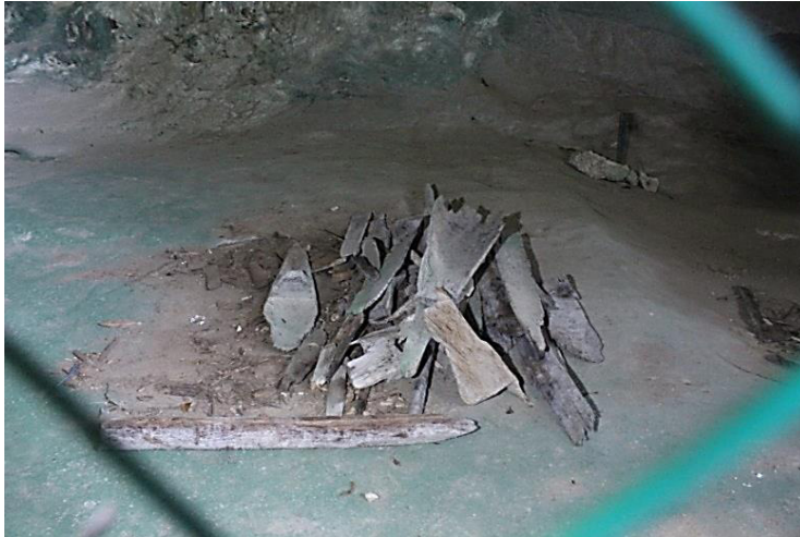
Foto 13 Artifak keranda perahu yang telah dikumpulkan

Bahan bukti kemajuan kehidupan masyarakat purba adalah jelas dengan adanya ‘keranda perahu’ tersebut. Perkara ini jelas menunjukkan kemajuan masyarakat purba melalui penciptaan teknologi ini. Terdapat sebab mengapa keranda ini berbentuk sedemikian dan sebagai penyelidik, perkara ini perlu diterjemahkan dalam usaha memberi pengetahuan dan penjelasan terhadap fenomena yang berlaku ketika zaman prasejarah tersebut.