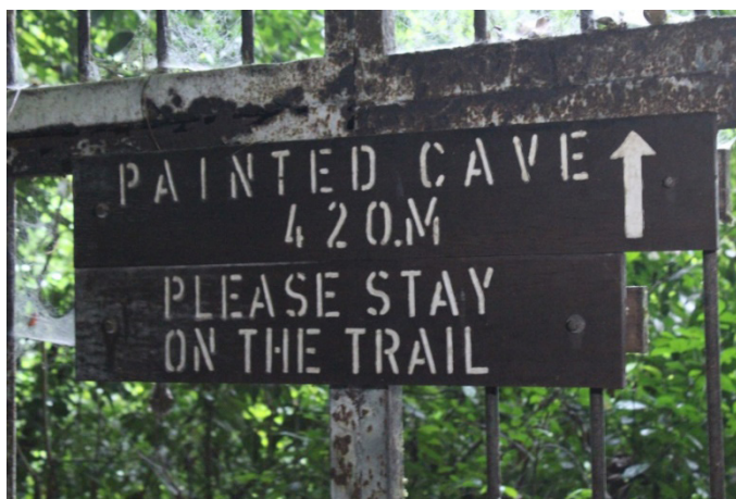
Foto 1 Papan tanda arah menunjukkan Painted Cave kira-kira 420 meter di hadapan

Penelitian terhadap lukisan dan ukiran yang terdapat dalam peninggalan purba di Gua Kain Hitam, Niah, Sarawak digolongkan sebagai lukisan dan ukiran dalam bidang cognitive archaeology , iaitu salah satu subbidang baharu dalam new archaeology 1 . Bidang ini memberi fokus terhadap bentuk pemikiran masyarakat