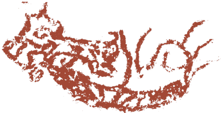
Foto 10 Aplikasi unsur garisan tebal dan beralun kelihatan jelas menghasilkan rupa perahu dan ‘ emerging tree ’ pada imej

Foto 9 menunjukkan satu imej perahu yang memiliki ciri-ciri yang disebut oleh Tom Harrison ‘ emerging tree ’ dari dasar perahu. Imej dihasilkan menggunakan unsur garisan yang tebal dan unsur rupa yang kompleks. Setiap garisan yang dibentuk adalah dinamik dan memberi gambaran dimensi pergolakan dalam imej ini. Aspek yang ditekankan dalam mencipta semula imej ini adalah dengan mengenal pasti ciri-ciri utama imej, iaitu kepelbagaian jenis garisan yang diaplikasikan untuk mendapatkan rupa yang dinamik.