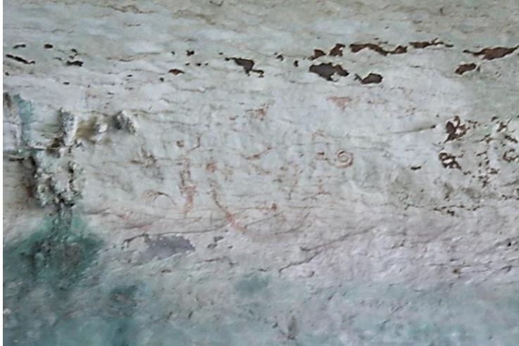
Foto 6 Panel ketiga dinding lukisan gua yang telah terjejas teruk disebabkan ditumbuhi lumut dan kesan debu yang tebal

Tapak penyelidikan ini juga menempatkan beberapa keranda berbentuk perahu. Semasa prosedur ekskavasi artifak dijalankan, keranda perahu dan rangka tulang masyarakat purba yang ditemui berada dalam keadaan berselerak di lantai gua. Beberapa bahan artifak purba seperti manik purba dan seramik juga telah ditemui. Pendapat penyelidik terdahulu melihat objek yang dijumpai ini mempunyai hubung kait dengan lukisan dinding gua yang berwarna merah menyala.