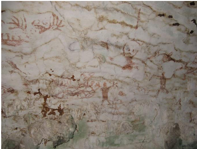
Foto 14 Lukisan hematit yang menghiasi death chamber di sepanjang panel dinding gua