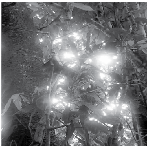
Foto 1 Pohon kulingkangon