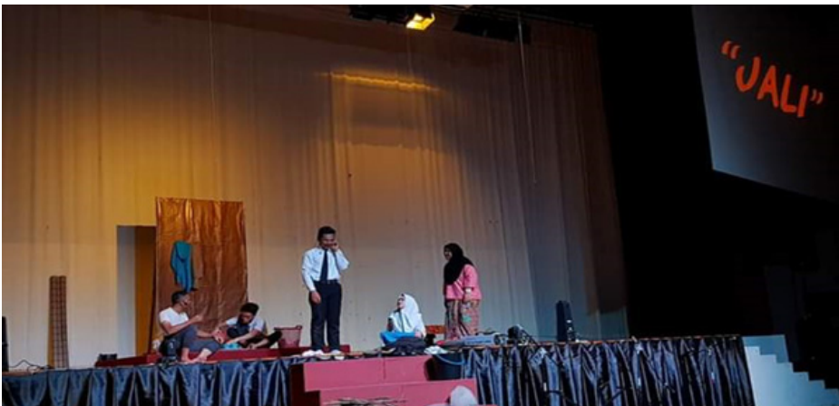
Foto 4 Pementasan drama dijalankan bagi melaksanakan anjakan paradigma dalam PdPc Kesusasteraan Melayu Komunikatif

Menurut Jimmy Bickerstaff (2011), terdapat beberapa elemen yang boleh dinilai melalui kreativiti persembahan. Walau bagaimanapun, penyelidik memilih tiga elemen utama yang boleh dinilai dari aspek kreativiti iaitu pengolahan skrip, lakonan dan aspek sinografi. Pertama, melalui bagaimana pelajar mengolah skrip drama tersebut. Keduanya, melalui lakonan dalam menghayati dan memperkembangkan watak perwatakan. Ketiga, adalah melalui sinografi seperti pembinaan set prop, tatarias, audio (muzik) dan solekan ( make-up ). Pelaksanaan kaedah teater dalam sesi PdPc mampu meningkatkan daya kognitif dan kreativiti pelajar (Nadarajan Thambu, 2014). Kajian yang dilakukan oleh Isnani Norasiken Mohamed Ali dan Muhammad Andi Mohammed Zulkepli (2015) berkenaan kaedah teater ternyata telah terbukti keberkesanannya dalam menyampaikan pengajaran yang menarik. Walau bagaimanapun, panduan yang lengkap dalam mengendalikan kaedah teater masih belum diperoleh atau digunakan di sekolah.