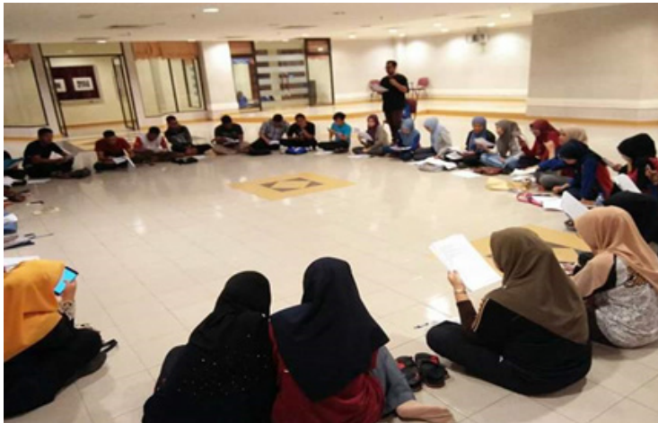
Foto 2 Sesi latihan dan pemilihan jawatankuasa dalam Produksi Teater

ilmu dan kemahiran yang lebih tinggi melalui kolaborasi yang erat dengan seorang guru atau melalui pembelajaran koperatif. Pembelajaran koperatif boleh dilakukan dengan mengadakan aktiviti secara berkumpulan supaya pelajar boleh berkolaborasi sesama mereka. Aktiviti berkumpulan seperti perbincangan dan gerak kerja kumpulan juga dapat mewujudkan interaksi yang berkualiti antara setiap pelajar. Melalui aktiviti dan perbincangan dalam kumpulan, pelajar dapat berkongsi idea, memperoleh pemahaman yang lebih jelas dan meluahkan buah fikiran. Sokongan dan bimbingan rakan dapat mendatangkan manfaat kepada setiap pelajar. Pelajar yang berkebolehan dan lebih berkemahiran boleh bertindak sebagai pengajar kerana murid lebih mudah faham apabila rakan sebaya yang membimbing kepada rakan sebaya demi penguasaan pengetahuan dan kemahiran yang dikehendaki (Critelli & Tritapoe, 2010).