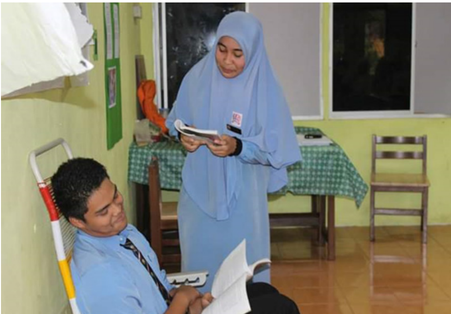
Foto 3 Murid sedang menjalani sesi latihan di dalam bilik darjah

produksi dan pascaproduksi. Tiga elemen ini melengkapkan dan menyusun strategi dalam proses pelaksanaan pementasan drama. Berdasarkan sorotan kajian, didapati tiada penyelidik yang menghasilkan kajian berkenaan kaedah produksi teater dalam PdPc genre drama. Justeru, dalam konteks kajian ini penyelidik memfokuskan fungsi produksi teater dalam konteks pendidikan, iaitu melalui PdPc genre drama. Kaedah Produksi Teater meletakkan proses kreativiti, iaitu setiap pelajar menjalani gerak kerja yang dapat memperkembangkan minda kreatif seperti lakonan, pengarah, pengurus pentas, pengolah skrip, pereka set (pentas), pereka prop, audio (muzik), pereka kostum dan tatarias ( make-up ). Objektif dalam PdPc genre drama adalah melalui gerak kerja dengan mementaskan drama dan menghasilkan naskhah drama seperti yang termaktub dalam Huraian Sukatan Mata Pelajaran Kesusasteraan Melayu (2003).