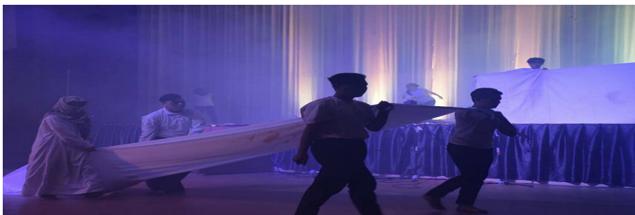
Foto 1 Murid beraksi mementaskan sebuah drama yang terkandung dalam genre drama

ditetapkan ketika disuruh menyatakan pendapat terhadap sesuatu masalah atau perkara. Murid secara langsung atau tidak langsung diberikan peluang meneroka peranan baharu untuk melaksanakan kerja-kerja mengendalikan sebuah pementasan seperti pengolah skrip, lakonan dan mereka bentuk dalam aspek sinografi seperti set, prop, kostum, audio, muzik dan make-up . Selain itu, murid dapat berkongsi bersama rakan kelas mencari penyelesaian sesuatu masalah yang terdapat dalam tugas yang diberikan.