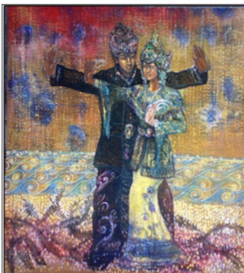
Foto 2 Gambaran Arung Salamiah menari tarian Panansang bersama Tanjung Kalang.

Sumber: Lukisan oleh Yee Ting Wong, Sabah Fest 2010