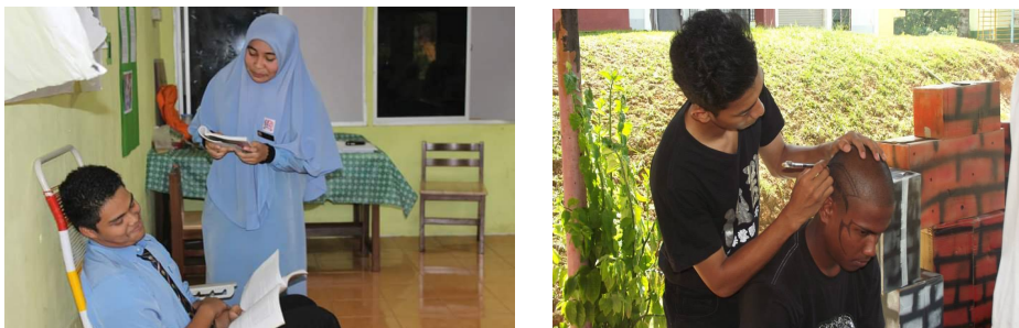
Rajah 2 Menganalisis watak oleh para pelajar

Justeru, dengan menjalani eksplorasi terhadap watak dan perwatakan tersebut, murid diberi peluang untuk menggunakan pemikiran secara kreatif dan kritis. Murid telah mengeksplorasi analisis watak (Rajah 2) dalaman dan luaran seperti melafazkan dialog, umur pelakon, rupa paras (keadaan fizikal) dan sebagainya. Selain itu, proses eksplorasi sesuatu watak dapat membantu seseorang murid menyelesaikan sesuatu permasalahan atau mencari inisiatif untuk mengusahakan sesebuah watak yang divisualisasikan. Kesungguhan murid juga dilihat berpeluang dalam mencari penyelesaian terhadap sesuatu kesesuaian dalam ‘menghidupkan’ watak perwatakan agar setiap hasil dapat disampaikan dengan baik dan mudah difahami oleh para pelakon dan penonton. Kemahiran lakonan yang melibatkan The System dapat membantu merangsang pemikiran murid dalam menerbitkan suatu bentuk pemikiran kritis.