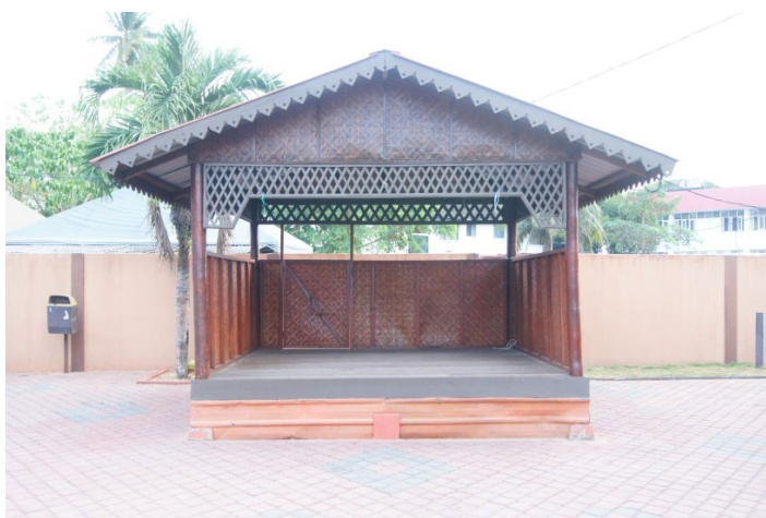
Foto 2 Bahagian hadapan panggung wayang kulit di Gelanggang Seni, Kota Bharu.

Gelanggang Seni terletak di tengah-tengah negeri Kelantan iaitu di Kota Bharu. Gelanggang Seni ini sentiasa menjadi daya tarikan dalam kalangan para pelancong dan anak-anak tempatan Kelantan yang cintakan seni warisan bangsa. Mereka akan berkampung dan mempersembahkan persembahan masing-masing. Persembahan yang masih digemari dan kerap diadakan terdiri daripada dikir barat, rebana ubi, permainan gasing, wau bulan dan wayang kulit. Persembahan ini didirikan pada hari Rabu setiap minggu secara bergilir-gilir. Gelanggang Seni ini diadakan untuk menumpukan segala aktiviti kesenian yang terdapat di negeri Kelantan pada satu lokasi agar mudah diakses bagi tujuan menggalakkan kunjungan pelancong atau pengunjung. Jabatan Pelancongan Negeri Kelantan telah mengaturkan acara kesenian ini untuk sepanjang tahun bagi tujuan promosi dan satu langkah memelihara kesenian Kelantan agar kekal berterusan dan berupaya dinikmati oleh orang ramai.