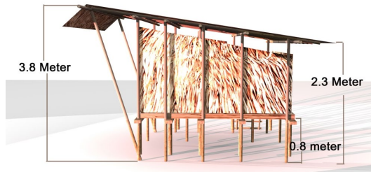
Foto 1 Lakaran panggung wayang kulit Kelantan Sumber: Dilukis kembali berdasarkan Shahrum Yub (1970).