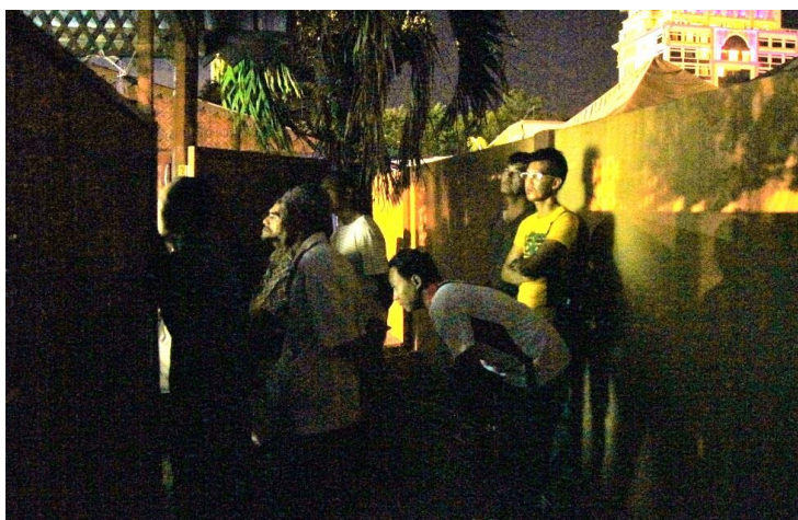
Foto 3 Penonton bebas berada sekitar panggung di Gelanggang Seni, Kota Bharu

Panggung ini juga bebas diakses oleh pengunjung atau pelancong semasa persembahan berlangsung. Pengunjung bebas berada di mana-mana bahagian yang mereka senangi semasa persembahan sedang berlangsung. Hal ini berbeza dengan pantang larang tradisional yang hanya membenarkan penonton berada dan menonton dari bahagian depan panggung atau kelir sahaja. Perubahan itu menunjukkan dalang sudah tidak berperanan dalam mengawal sikap atau tindakan masyarakat melibatkan kawalan sosial sewaktu persembahan wayang kulit, sekali gus membuktikan penghapusan nilai kepercayaan tradisional dan amalan pantang larang dalam kalangan penonton kini.