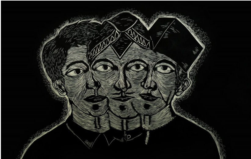
Rajah 2 Maphilindo (Kesatuan). Woodcut . 132 cm x 83.5 cm, (2015)