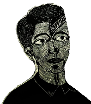
Rajah 3 Figura lelaki memakai pakaian barong melalui teknik tindihan dengan figura lelaki yang memakai blangkon .

yang memakai blangkon (Rajah 3). Figura yang kedua adalah wajah seorang lelaki yang memakai blangkon 2 , iaitu pertindihan imej dengan figura lelaki di sebelah kiri dan kanan (Rajah 4). Imej yang ketiga adalah wajah seorang lelaki bersongkok 3 dan memakai baju Melayu yang menampilkan leher Teluk Belanga 4 . Figura ini adalah berkombinasi dengan imej seorang lelaki yang memakai blangkon (Rajah 5). Pengkarya turut menggabungkan beberapa elemen seni seperti warna hitam, garisan, jalinan, rupa, bentuk, ruang dan pergerakan untuk mewujudkan kesatuan imej yang digambarkan.