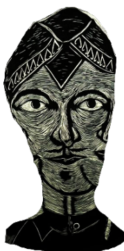
Rajah 4 Figura lelaki berpakaian blangkon secara bertindih dengan figura lelaki pada bahagian kanan dan kiri.