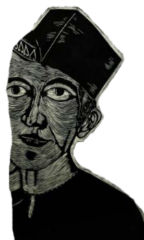
Rajah 5 Figura lelaki bersongkok bertindih dengan wajah lelaki yang memakai blangkon di bahagian tengah.