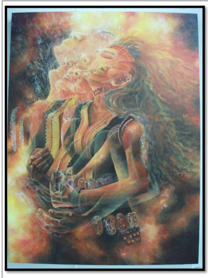
Foto 2 Unsur formalistik dalam karya Huminodun Spirit