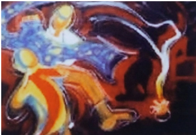
Foto 1 Unsur formalistik dalam karya Ya Bamba Ya Lukah