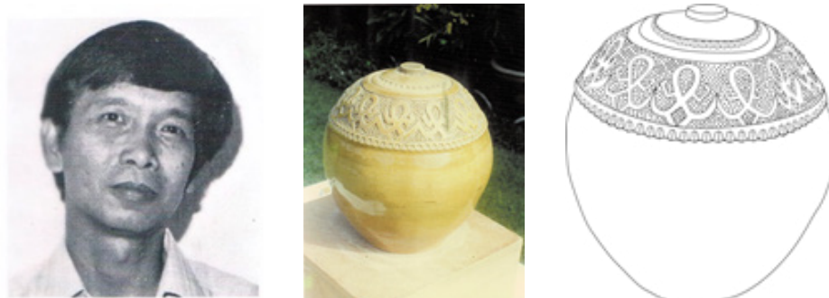
(i) Gambar potret tokoh (ii) Arca 'Tanpa Tajuk' dihasilkan pada tahun 1989 (iii) Lakaran struktur arca

menyambung pelajaran di Maktab Perguruan Ilmu Khas pada tahun 1967. Kemudian, beliau melanjutkan pengajiannya dalam bidang Seni Tembikar dan dianugerahkan Advanced Diploma Educational Studies dari Brighton Polytechnic College of Art, United Kingdom pada tahun 1973 hingga 1974. Setelah tamat pengajian, beliau bertugas di Sekolah Menengah Kebangsaan Gunsanad, Keningau. Pada tahun 1977, beliau dilantik menjadi pensyarah Pendidikan Seni di Maktab Perguruan Gaya, Kota Kinabalu dan bertugas di sana selama 14 tahun. Pada tahun 1979, beliau dilantik menjadi Ketua Jabatan Seni di Maktab Perguruan Gaya. Pada tahun 1990, beliau dipertanggungjawabkan di Koperasi Pembangunan Desa (KPD) Sabah dengan menjawat jawatan sebagai Pegawai Kraf Tangan. Sumbangan dan jasa beliau dalam bidang seni dan kraf membawa kepada penganugerahan bintang kebesaran sebagai Ahli Darjah Kinabalu (A.D.K.) kepadanya pada 1991. Beberapa siri pameran pernah disertai seperti di Brighton Polytechnic College of Art pada tahun 1974. Seterusnya, Pameran Pembuatan Tembikar Berhias di Maktab Perguruan Khas di Cheras, Kuala Lumpur pada tahun 1967. Pada tahun 1985, beliau mengadakan pameran solo seni tembikar di Balai Seni Lukis Sabah. Beliau yang meminati bidang seni telah menyertai Badan Seni Sabah dan memegang jawatan yang tinggi dalam persatuan tersebut. Beliau juga menjadi ahli jawatankuasa tetap Balai Seni Lukis Sabah dari tahun 1986 hingga 1991 (Teddy Marius Soikun, 2013: 112-125).