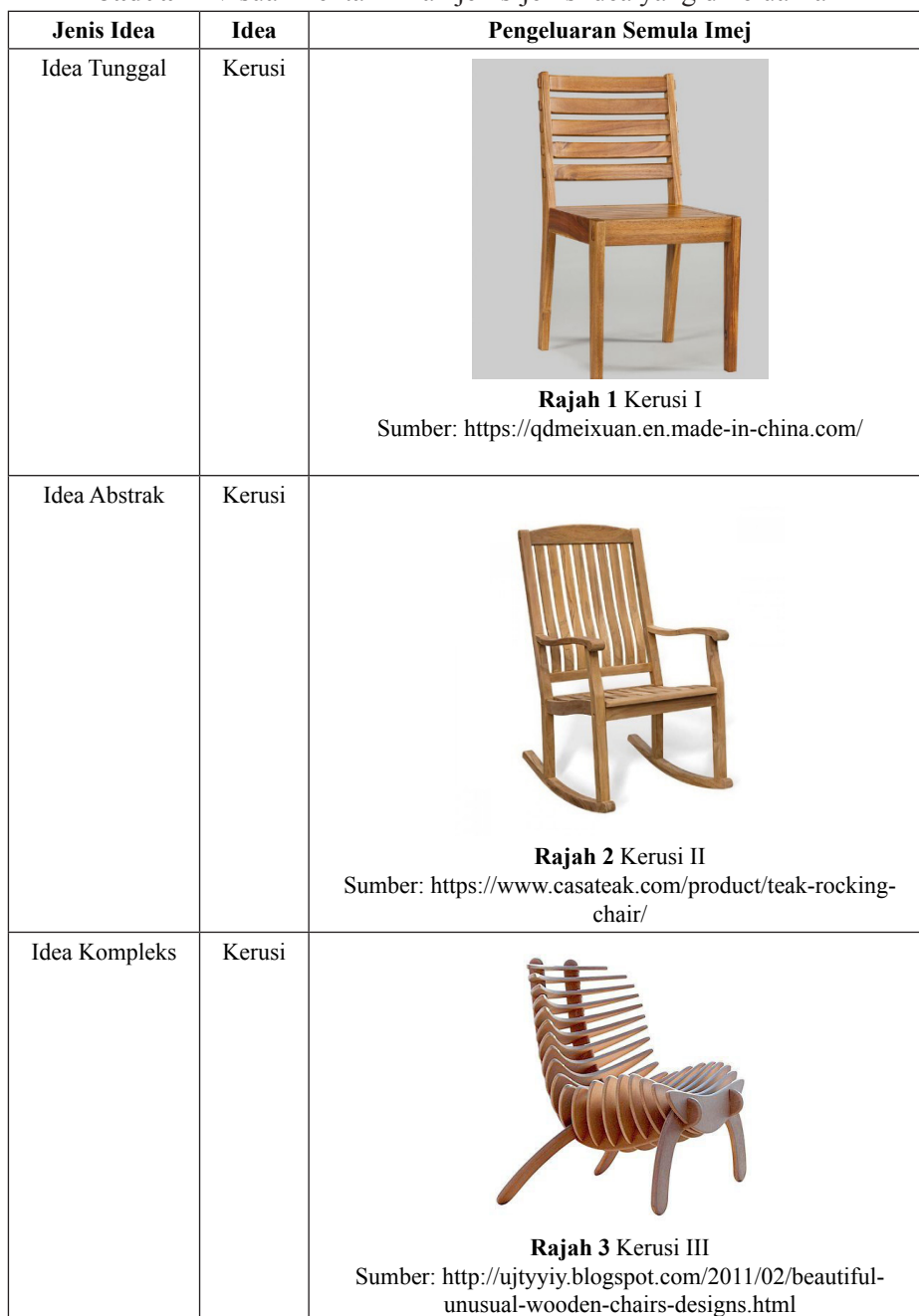
Jadual 1 Visual mentakrifkan jenis-jenis idea yang dikeluarkan

terhasil secara langsung dianggap sebagai idea tunggal, manakala idea abstrak pula terhasil secara tidak langsung dan berdasarkan pengalaman visual. Idea kompleks terhasil melalui gabungan pelbagai aspek. Contoh pembahagian idea dapat dilihat pada Jadual 1.