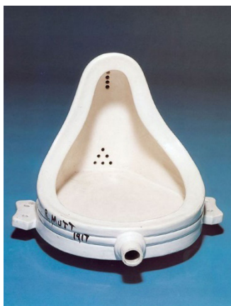
Rajah 6 “ Fountain ”, Marcel Duchamp, 1917/1964. Seramik bersepuh dan cat hitam, 61 cm x 48 cm x 36 cm.