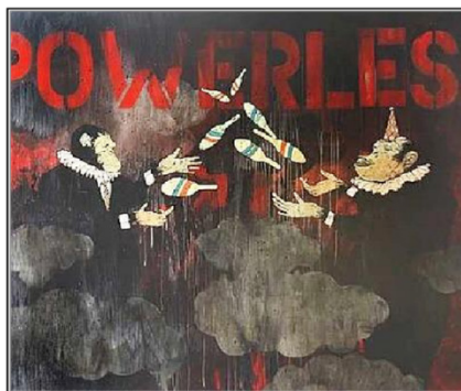
Rajah 5 “ Powerless ”, Samsudin Wahab, 2008, Media campuran atas kanvas, 83 cm x 152 cm.