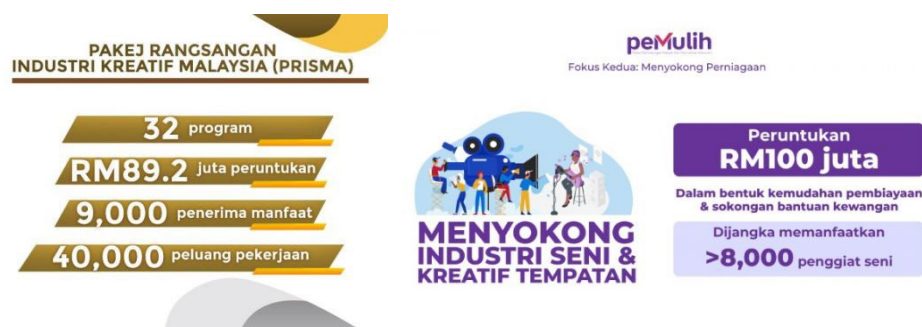
Rajah 2 Infografik bantuan dari pihak kerajaan.