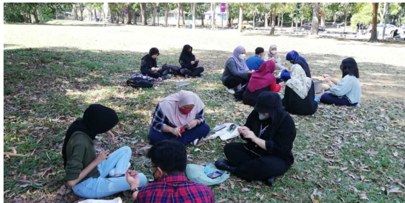
Foto 2 Aktiviti bersama pelajar

Walau bagaimanapun, untuk pameran kali ini pihak penganjur hanya dapat menjangkakan pameran ini sehingga bulan Ogos 2022 sahaja. Namun begitu, ia juga bergantung kepada keperluan pengarca untuk memindahkan karya arca tersebut ke tempat lain. Dalam pada itu, pihak penganjur telah menjalankan beberapa aktiviti bagi memeriahkan pameran arca awam ini, termasuklah bicara bersama pengarca, aktiviti bersama pelajar sekolah serta masyarakat setempat. Dalam masa yang sama, pihak penganjur telah membangunkan satu aplikasi yang mana ia merupakan aplikasi pertama seumpamanya. Aplikasi ini dibangunkan bagi membolehkan penghayat berinteraksi dengan penganjur dalam bentuk akademik. Dalam aplikasi tersebut juga terdapat unsur-unsur pembelajaran yang mana penghayat diberi manual untuk menghasilkan karya arca dengan menggunakan bahan semula jadi yang terdapat di persekitaran tempat pameran. Penghayat juga boleh memuat naik gambar hasil karya yang dihasil.