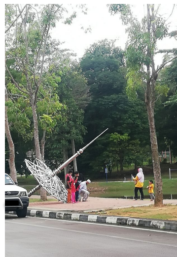
Foto 4 Pengunjung berinteraksi bersama karya arca