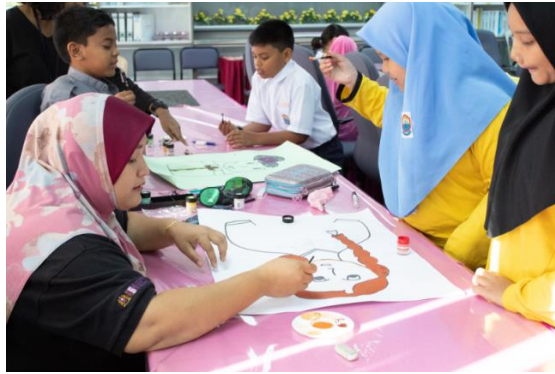
Rajah 1 Kanak-kanak mencipta watak dan personaliti dalam cerita rakyat semasa sesi bengkel.