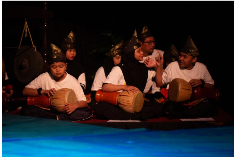
Rajah 2 Kanak-kanak menjadi pemuzik semasa persembahan bengkel Wayang Kulit. Sumber: Pusat Pengajian Seni, USM and geran FRGS (Fundamental Research Grant Scheme), (Silk Shadows Speak: A Study of Malaysian Children’s Voices on Heritage Folktales Using Performative Tools), 2017-2020. Kementerian Pengajian Tinggi Malaysia