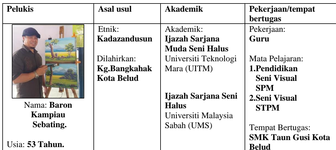
Jadual 2: Latar Belakang Baron Kampiau Sebatang

Seperti yang dinyatakan, kajian ini melibatkan pelukis Baron Kampiau Sebatang yang menampilkan imej Gunung Kinabalu dengan lebih kritikal dari segi makna dan falsafah di dalam catan beliau. Baron beranggapan catan adalah medan untuk menyalurkan manifestasi budaya etnikinya. Berikut Jadual 2 dinyatakan latar belakang pelukis Baron Kampiau Sebatang. Manakala Jadual 3 merupakan rekod pencapaian peribadi dan rekod pameran yang disertai sepanjang keaktifan beliau sebagai seorang pelukis Sabah.