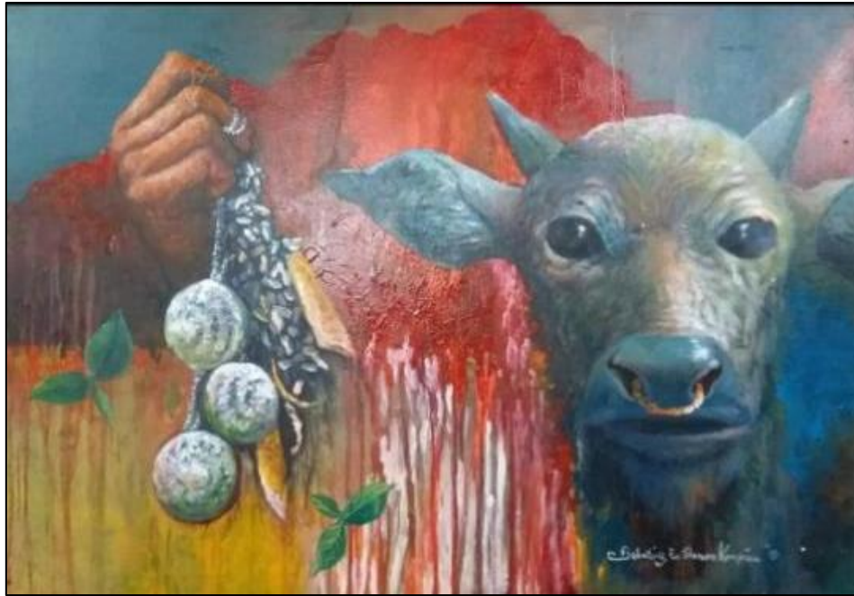
Gambar 1: 'Gunung Kinabalu Menangis'. 2015. Sumber: Baron Kampiau Sebatang

Dalam konteks merungkai gejala ikon budaya dalam karya Baron Kampiau Sebatang yang bertajuk 'Gunung Kinabalu Menangis' (2015) di atas, berikut ditunjukkan analisis khusus kajian: