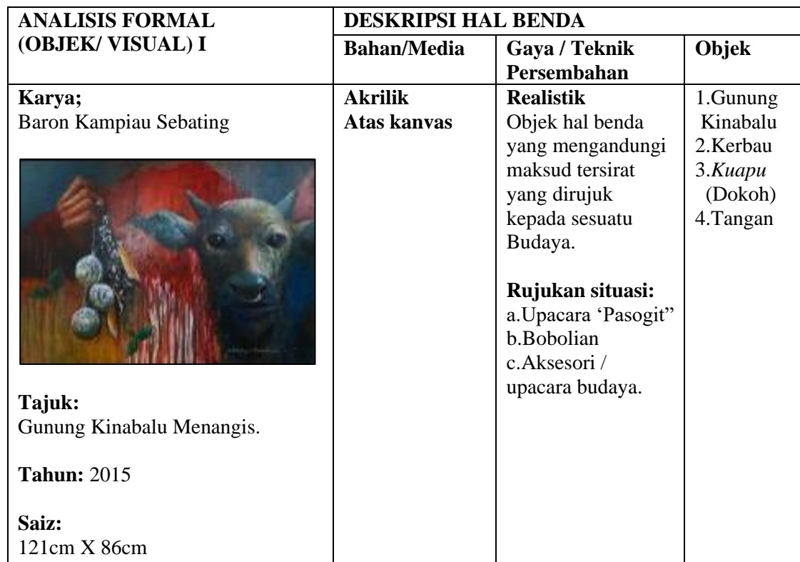
Jadual 4: Analisis Karya Baron Kampiau Sebatang

Dalam konteks merungkai gejala ikon budaya dalam karya Baron Kampiau Sebatang yang bertajuk 'Gunung Kinabalu Menangis' (2015) di atas, berikut ditunjukkan analisis khusus kajian: