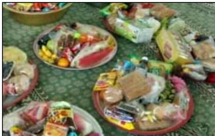
Rajah 3: Barangan sedekah yang disediakan oleh keluarga pesakit sebagai upah kepada Tukang Tawal

Selepas Si Tukang Tawal selesai mengubati pesakit, keluarga pesakit akan memberikan sedekah kepada si Tukang Tawal sebagai upah beliau merawat pesakit. Menurut Puan Haimah Basaluddin, antara barang-barang yang diberikan bagi membayar upah si Tukang Tawal adalah seperti 5 kg beras, roti, buah-buah seperti pisang, keropok dan juga kek. Sedekah yang diberikah adalah tidak terikat kepada suatu jumlah yang tetap dan bebas mengikut kemampuan sesebuah keluarga itu. Selepas sedekah dihantar ke rumah Tukang Tawal, si Tukang Tawal akan mendoakan kesejahteraan keluarga pesakit dan sentiasa dalam lindungan.