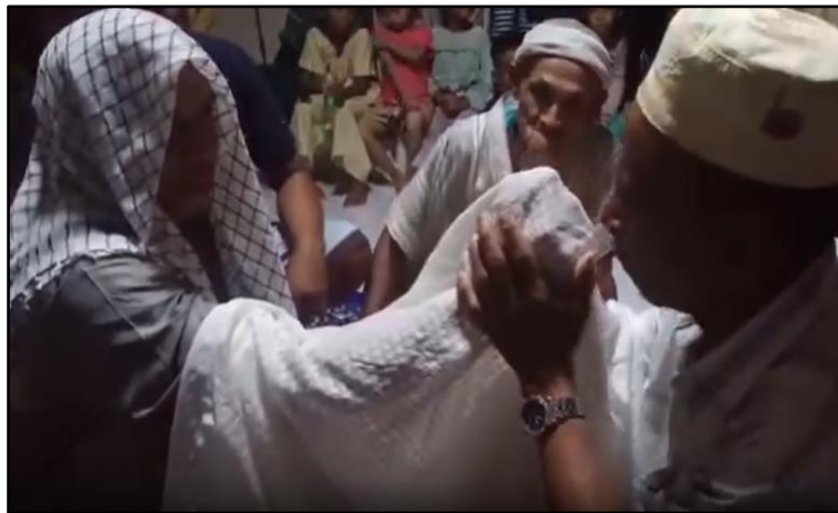
Rajah 2: Si Tukang Tawal sedang membacakan doa / mantera di tangan pesakit

Bagi penyakit ringan seperti terseliuh dan sakit di badan pula, Si Tukang Tawal akan membacakan doa terus secara langsung di kawasan anggota badan yang sakit sambil menyapukan atau mengurut bahagian yang sakit tersebut. Selain itu, Si Tukang Tawal juga membacakan doa di bahagian atas kepala kerana menurut Puan Anang Abdul Hamid, kepala merupakan laluan roh kehidupan manusia.