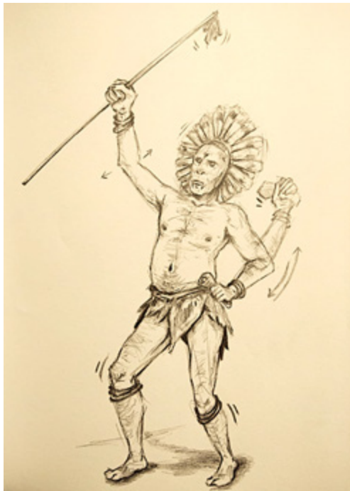
Rajah 10 Ilustrasi shaman

Daripada keseluruhan dinding gua, terdapat satu imej manusia dibentuk lebih besar dan dilukis dengan garis kasar. Imej ini sepenuhnya berwarna merah dan dilukis sedang berpakaian sambil memegang sebatang tongkat yang dililit pada tangannya. Menurut Mohd Sherman bin Sauffi (temu bual, 16-17 Oktober 2019), motif ini merujuk kepada topeng muka seorang shaman yang mengetuai upacara pengebumian masyarakat prasejarah ketika itu. Jelas sekali figura sedang menari adalah seorang manusia menurut beliau. Imej figura manusia terdiri daripada jenis strokes seperti garisan menegak, untuk batang badan, dan bentuk garisan untuk empat anggota badan dan satu bulatan untuk kepala. Figura manusia itu dilukis dengan bentuk bulatan untuk mewakili setiap kepala.