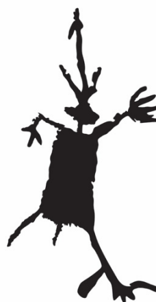
(ii) Ilustrasi imej