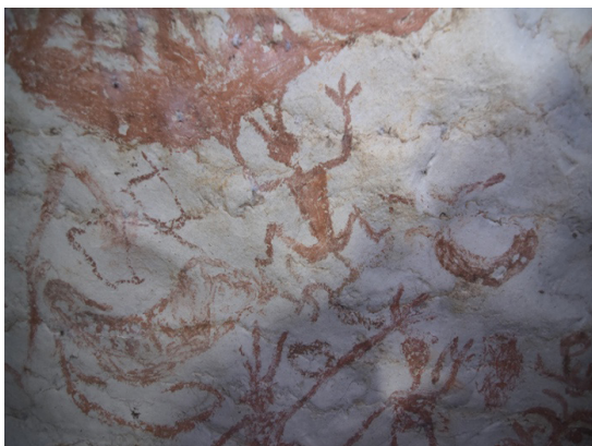
(i) Lukisan gua