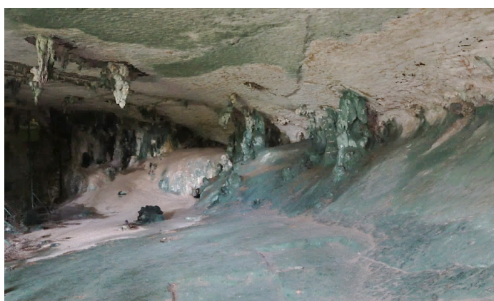
Rajah 1 Peta lokasi kawasan kajian

Lukisan prasejarah merupakan suatu fenomena penting dalam dunia seni lukisan moden pada hari ini. Penggiat seni adalah digalakkan untuk memahami sejarah seni dan perkembangannya kerana isu kesedaran terhadap pensejarahan seni dapat menentukan arah masa depan seni catan moden di Malaysia.