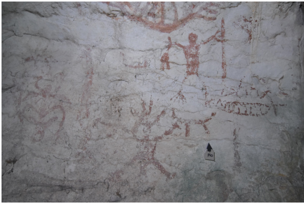
(i) Lukisan gua

Rajah 6 (i) menunjukkan figura dalam posisi tangan dan kaki terbuka. Di kepala figura dihasi dengan tiga garisan yang menunjukkan hiasan pakaian pada figura ketika itu. Figura ini dalam posisi berdiri dengan tangan ke atas dan kaki terbuka. Ilustrasi Rajah 6 (ii) menunjukkan figura dihasilkan dengan kaki yang tidak lengkap. Imej ini dipercayai sebagai representasi kepada shaman lelaki berdasarkan bahagian kelamin yang ditonjolkan pada imej.