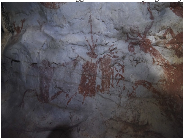
(i) Lukisan gua

Lukisan pada Rajah 5 (i), berbentuk hiasan kepala yang bervariasi yang digambarkan seperti menggunakan bulu burung dan objek unik yang diikat di kepala malah, imej seolah-olah hiasan seperti orang Minangkabau di Sumatera. Hiasan seperti ini adalah antara identiti masyarakat peribumi Sarawak hingga hari ini. Ilustrai Rajah 5 (ii) menunjukkan tangan figura sedang memegang objek yang sukar dikenal pasti. Lebih menarik, lukisan imej manusia ini menunjukkan jantina lelaki berdasarkan anggota alat kelamin yang ditonjolkan dalam imej tersebut.