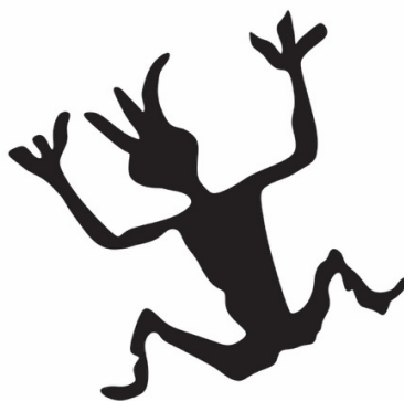
(i) Ilustrasi imej