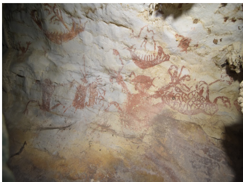
(i) Lukisan gua

lengkap. Dalam ilustrasi Rajah 4 (ii) menampilkan struktur tubuh yang tidak seimbang dan juga posisi anggota badan yang dinamik. Ketiga-tiga imej figura ini memiliki anggota tangan yang panjang dan dalam posisi tangan diangkat ke atas.