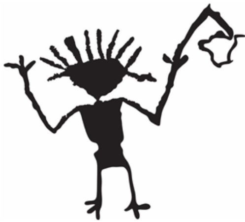
(ii) Ilustrasi imej