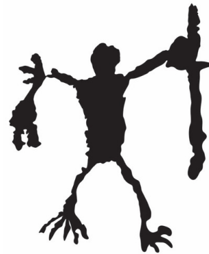
(ii) Ilustrasi imej