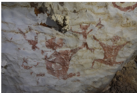
(i) Lukisan Gua

Rajah 3(i) Menampilkan bentuk figura dengan hiasan kepala yang berbentuk seperti helaian bulu haiwan atau helaian daun. Figura dibentuk secara statik dengan tangan dan kaki dalam keadaan terbuka. Ilustrasi Rajah 3 (ii) menunjukkan figura yang dilukis dengan postur tubuh secara tidak simetri dan dalam penuh gaya. Struktur tubuh yang tidak seimbang dan juga posisi anggota badan yang statik memberi gambaran unik terhadap perlakuan mereka dalam situasi yang digambarkan oleh pelukis prasejarah. Figura bersaiz besar ini dihiasi dengan headgear atau hiasan kepala.