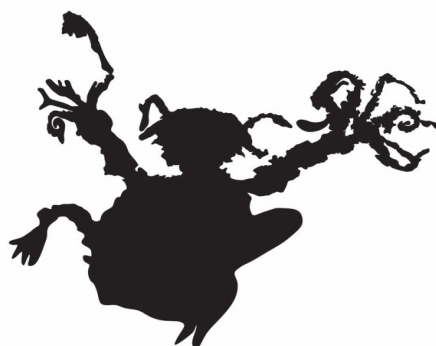
(ii) Ilustrasi imej