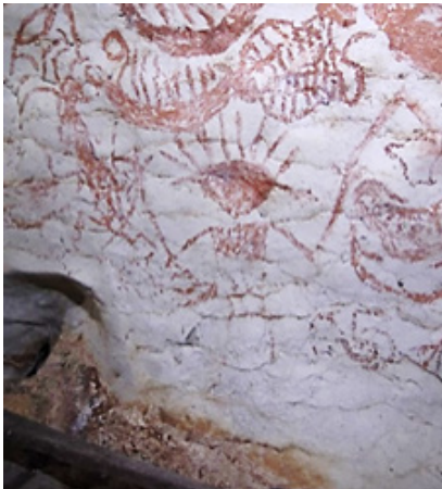
(i) Lukisan gua