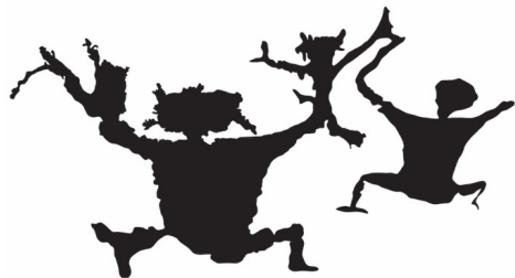
(ii) Ilustrasi Imej