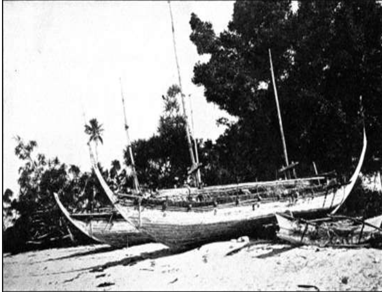
Gambar 3: Kapal Garay Milik Pembesar Sulu

Sumber: Sixto Y. Orosa, The Sulu Archipelago and Its People , New York: World Book Company, 1931, hlm. 28; James Warren, At The Edge of Southeast Asian History , Quezon City: new Day Publishers, 1987, hlm. 42.