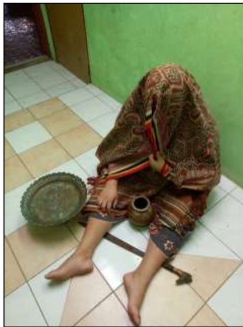
Foto 2 : Tukang sabak Sedang Melakukan Upacara Nyabak (Posisi Pertama)

Semasa menyanyi, tukang sabak akan memegang kain pua dengan tangan kiri untuk menutup mukanya, manakala tangan kanannya berpahut pada orang di sebelahnya (selalunya kaum perempuan atau kerabat perempuan keluarga si mati) untuk menyokongnya. Kakinya diletakkan pada sebatang besi atau duku ilang untuk menguatkan semangatnya supaya tidak alah ayu .