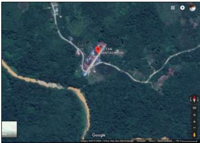
Peta 2: Kampung Tr. Tan Rantau Kiran, Nanga Medamit, Limbang