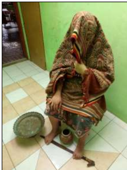
Foto 3: Tukang Sabak Sedang Melakukan Upacara Nyabak (posisi kedua)

Sabak kenang adalah bertujuan untuk mengenang si mati. Selalunya Sabak kenang dilakukan ketika perayaan Gawai Antu . Sabak jenis ini tidak memanggil sebayan . Ianya bertujuan untuk meningat semua orang yang sudah mati bahawa keluarga mereka yang masih hidup masih merindukan mereka. Selalunya dalam sabak kenang akan menyebut memori yang pernah dilakukan oleh si mati ataupun bersama si mati.