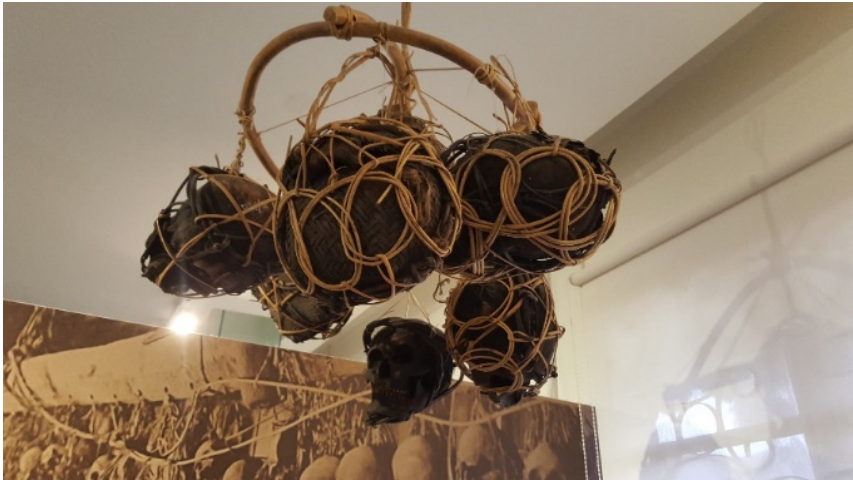
Foto 3 Antu Pala