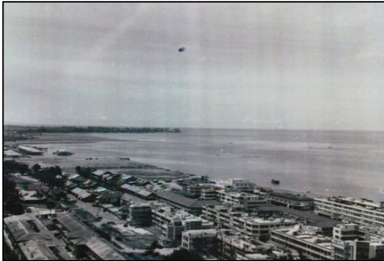
Foto 4: Jesselton pada tahun 1961