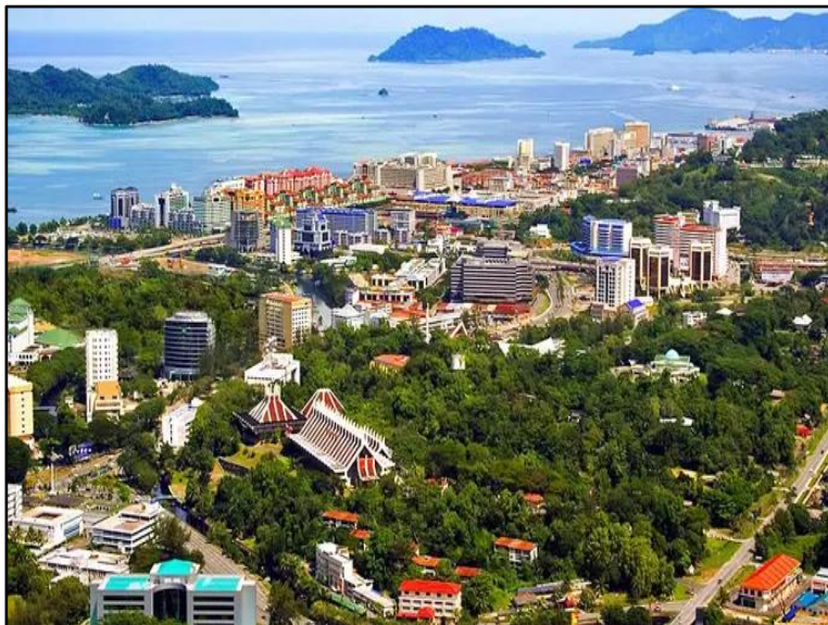
Foto 5: Kota Kinabalu pada tahun 2015

Hakikatnya, kadar pembangunan di Jesselton tampak lebih pantas pada pasca Perang Dunia Kedua. Beberapa peringkat pembangunan telah dilakukan, seperti pembangunan berbentuk transisi