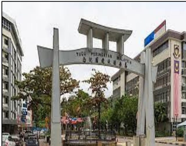
Foto 8: Tugu Peringatan Malaysia yang benar-benar terletak bersebelahan dengan pejabat Dewan Bandaraya Kota Kinabalu (DBKK)

tapak warisan oleh mana-mana pihak sama ada di peringkat pusat ataupun negeri. Adapun, pihak yang bertanggungjawab terhadap keseluruhan aspek konservasi dan pemeliharaan buat masa ini hanyalah di bahu Dewan Bandar Raya Kota Kinabalu (DBKK) sahaja (Zainuddin, 2014). Sudah tentu sekiranya perkara ini kekal pada penyeliaan peringkat kerajaan tempatan dalam tempoh yang lama, tidak wujud sebarang jaminan yang signifikan terhadap kemaslahatan monumen bersejarah ini apabila autoriti pihak DBKK hanyalah signifikan pada tempoh jangka pendek sahaja dari sudut kawalan dan tindakan legalisasi berdasarkan kepada Seksyen 38(1) dan 49(1)(23) Ordinan Kerajaan Tempatan 1961 (Rang Undang-Undang Negeri Sabah, 1962).