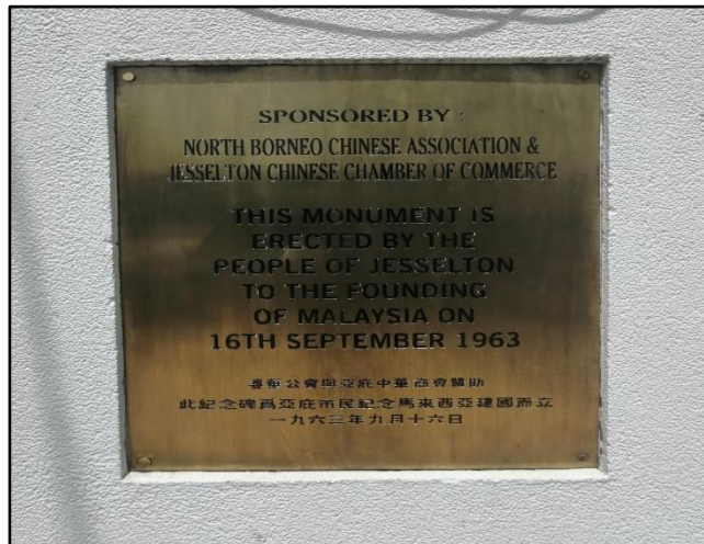
Foto 7: Plak peringatan yang pernah dicuri oleh individu tidak bertanggungjawab

Dalam konteks tapak warisan sebagai suatu potensi pelancongan warisan, Tugu Peringatan Malaysia sememangnya masih ketinggalan dari sudut itu. Maksud ketinggalan di sini bukanlah disebabkan oleh ketiadaan langsung para pelancong dan masyarakat ke kawasan tersebut. Tetapi, objektif dan ketersampaian maklumat mengenai latar belakang tapak warisan ini tidak dapat dicapai. Tamsilnya, komuniti yang berada di tapak tidak berupaya mendapatkan sebarang informasi yang mencukupi serta mampu menjelaskan asal usul dan sebab berdirinya monumen itu. Justeru, komuniti juga mengalami kesukaran untuk mendapatkan informasi apabila tiada siapapun individu mahupun perwakilan daripada unit atau jabatan organisasi pengurusan sumber warisan yang wujud secara terbuka dan mandiri. Malaysia sememangnya sebuah negara yang kaya dengan warisan-warisan sejarah perlu diangkat sebagai industri pelancongan yang berupaya menjana pendapatan melaluinya (Zuliskandar Ramli et. al., 2015: 472).