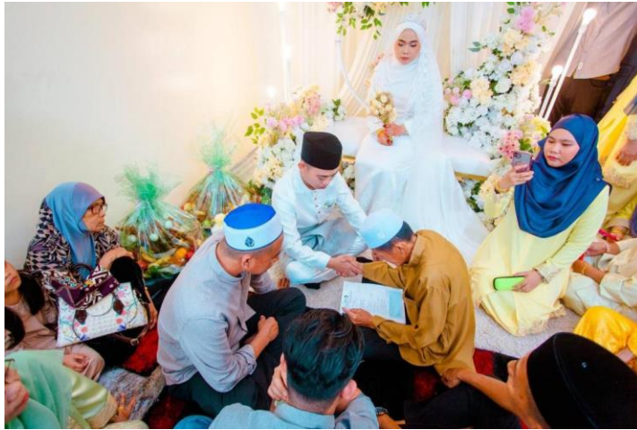
Foto 4: Akad nikah masyarakat Suluk tanpa adat tradisional