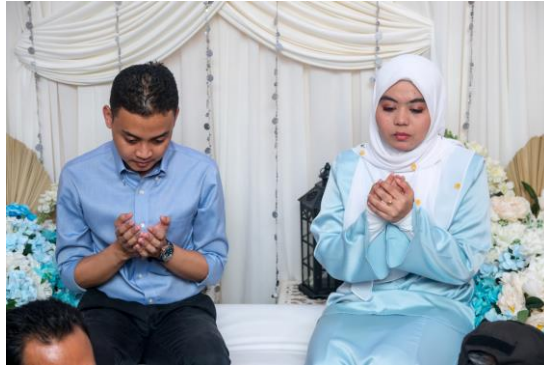
Foto 1: Adat bertunang Pag-Turul Taima