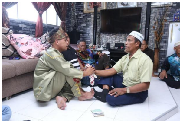
Foto 2: Upacara akad nikah masyarakat Suluk