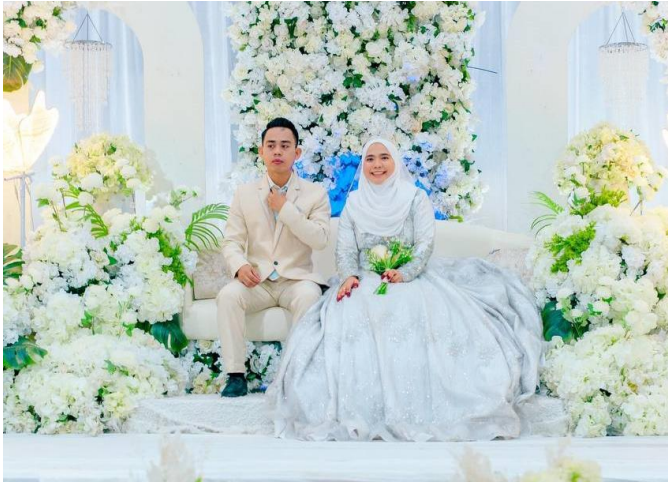
Foto 3: Pakaian Gaun dan Suit dalam Perkahwinan Moden Masyarakat Suluk