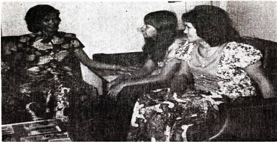
Foto 3: Kaum Ibu USNO Sedang Membincangkan Masalah Pendidikan Anak-Anak