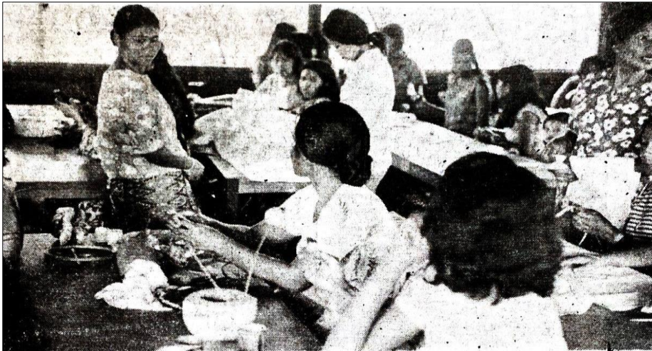
Foto 2: Kaum Ibu USNO Sedang Membuat Kerja-Kerja Latihan