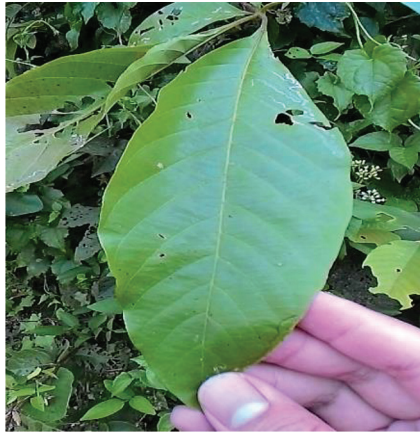
FOTO 1 Daun kolimpopo (daun hutan yang dipercayai mempunyai semangat halus)

biasanya tumbuh di dalam hutan dan disebabkan banyak tumbuhan lain gemar menumpang di bahagian akar sehingga ke batang pokok tersebut. Masyarakat Bajau Sama' percaya bahawa pokok tersebut mempunyai banyak khasiat yang mampu membantu manusia.