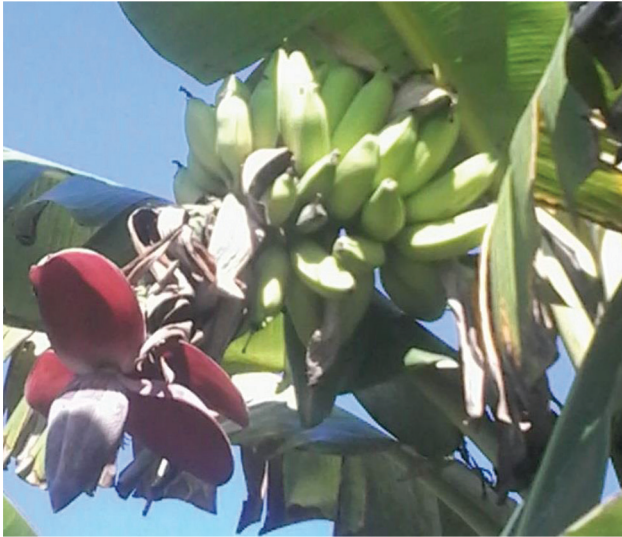
FOTO 4 Pisang kenawar serba guna yang digunakan dalam merawat penyakit gastrik