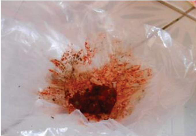
FOTO 2 Bahan sirih yang telah dikunyah oleh tukang manak (bidan)