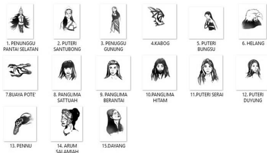
Foto 4 Lakaran watak-watak yang hadir dalam ritual Pag Pahaya Baihu ’ mengikut gambaran dari Ombo ’ dalam ritual yang dijalankan pada 21 Disember 2017

yang menjadi salah satu sebab mengapa Ombo ’ berjalan keluar rumah dan duduk di kawasan yang lapang. Begitu juga jika yang hadir adalah Puteri Duyung, maka ia akan menyebabkan pergerakan tubuh badan Ombo ’ menjadi seperti ikan yang terdampar di tepi pantai sambil menangis.