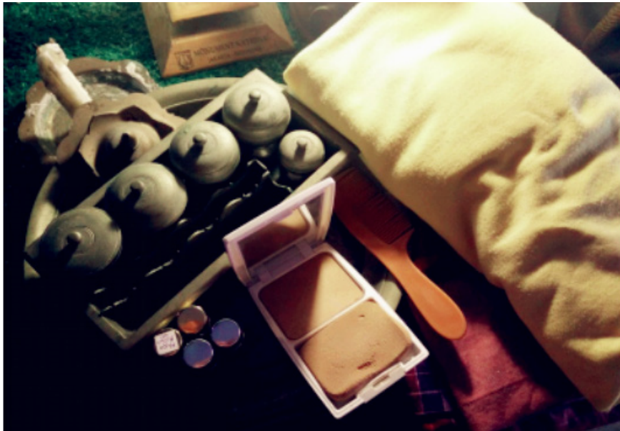
Foto 3 Antara keperluan asas yang perlu disediakan semasa ritual Pag Pasahaya Baihu'

Dalam persembahan teater, prop merupakan barang-barang yang dibawa atau digunakan oleh pelakon semasa berada di atas panggung (Jakob Soemardjo, 1941). Peralatan prop hendaklah berfungsi untuk memperkukuhkan penjelasan perwatakan yang dimainkan oleh pelakon. Peralatan ini juga membantu pelakon untuk mendapatkan mood ketika berlakon, sekali gus mewujudkan aksi dan interaksi kepada suasana yang sedang berlangsung.