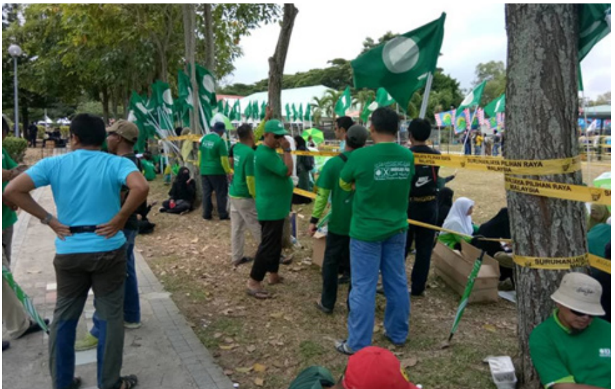
Rajah 3 Proses penamaan calon PAS Sabah PRU-14, Dewan Masyarakat Sulaman, Taman Kingfisher, Kota Kinabalu Sumber Kajian lapangan penyelidik, 28 April 2018