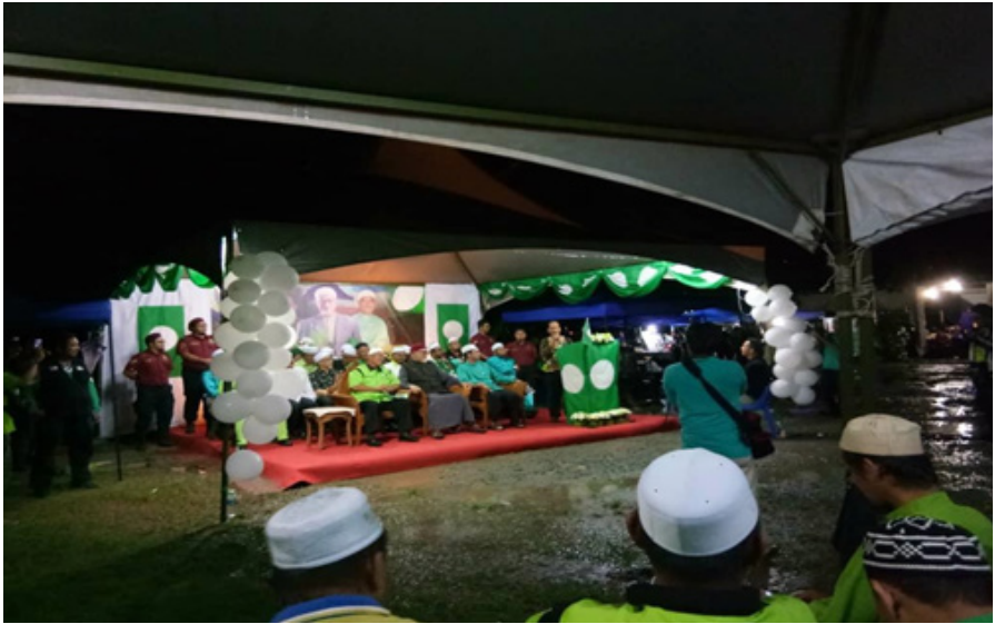
Rajah 2 Ucapan pengenalan diri Satail Majungkat, calon bukan Islam PAS Sabah Sumber Kajian lapangan penyelidik, Tuaran, 22 April 2018