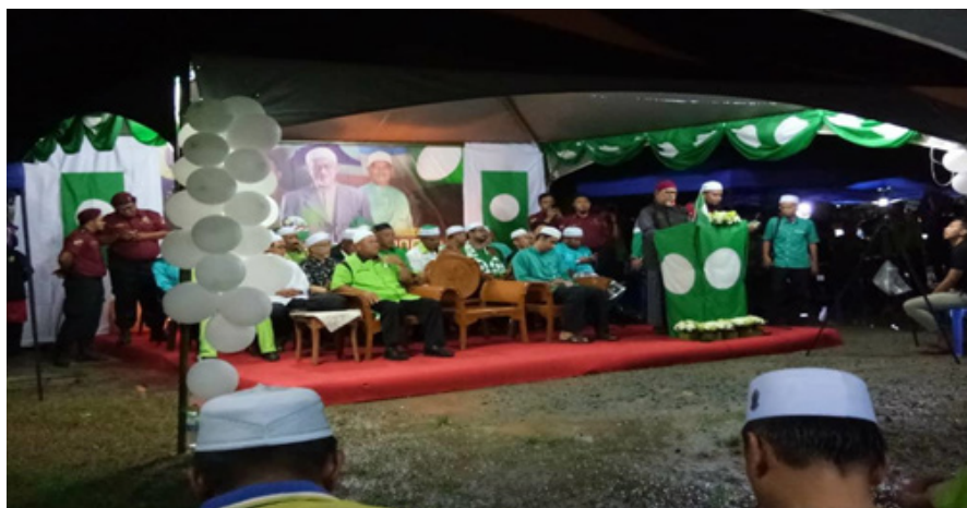
Rajah 1 Majlis pengumuman calon PAS Sabah PRU-14 oleh Presiden PAS Sumber Kajian lapangan penyelidik, Tuaran, 22 April 2018