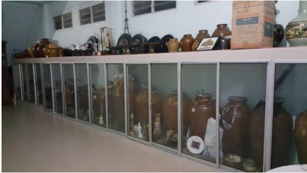
Sumber: Kerja lapangan (2019)