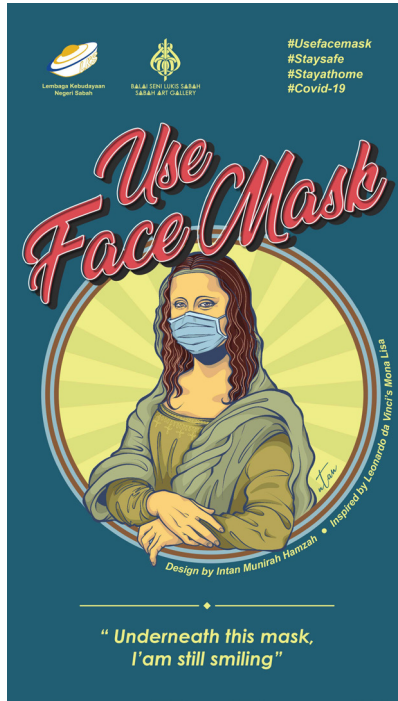
Foto 1 Intan Munirah Hamzah, Use Face Mask , 2020, poster digital

Foto 1 yang bertajuk Use Face Mask ini merupakan salah satu dari siri poster Covid-19 oleh Balai Seni Lukis Sabah yang dimuatnaik dalam media sosial pada minggu kedua kedua Perintah Kawalan Pergerakan (PKP) diperkenalkan. Ia menggambarkan potret seorang perempuan iaitu Monalisa yang merupakan sosok figura ikonik dari karya catan pelukis tersohor Itali iaitu Leonardo Da Vinci. Unsur visual tersebut telah diappropriasi oleh pencipta karya poster ini iaitu Intan Munirah Hamzah melalui manipulasi digital terhadap bentuk, kesan jalinan dan juga warna yang pada dasarnya disederhanakan olehnya sehingga cenderung berubah dari gaya pengucapan asalnya yang bersifat realistik kepada gaya pengucapan yang bersifat ilustrasi