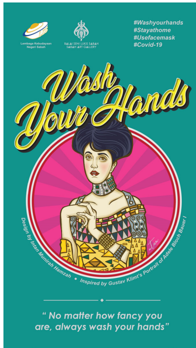
Foto 3 Intan Munirah Hamzah, Wash Your Hands , 2020, poster digital