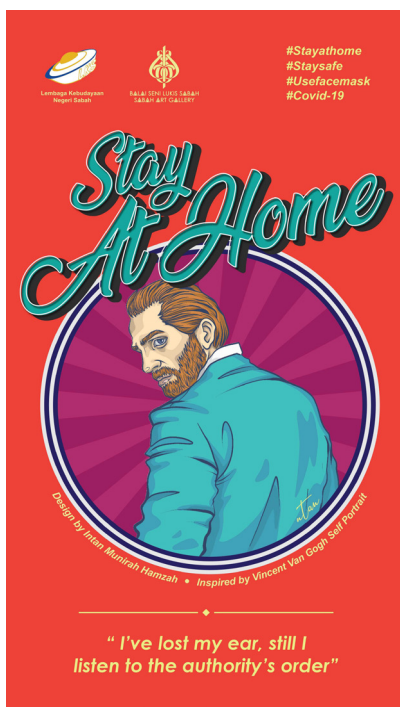
Foto 2 Intan Munirah Hamzah, Vincent Stay at Home, 2020, poster digital

Foto 2 adalah karya poster kedua dari siri poster Covid-19 dari Balai Seni Lukis Sabah yang bertajuk Stay at Home ini memperlihatkan gambaran potret seorang lelaki separuh tubuh dari pandangan belakang tetapi wajahnya dipalingkan ke arah sisi sebelah kiri bidang komposisi. Berdasarkan judul karya dan juga atribut yang tampil pada wajahnya yang berambut keperangan dan juga memiliki jambang yang lebat, sosok lelaki ini merupakan representasi dari Vincent van Gogh, seorang pelukis kelahiran Belanda yang begitu terkenal dengan karya-karya potret diri dan lanskap dengan gaya Pasca Impressionisme yang dicirikan melalui sapuan warna-warna buram, garisan berat dan ilusi pergerakan udara dan juga cahaya.