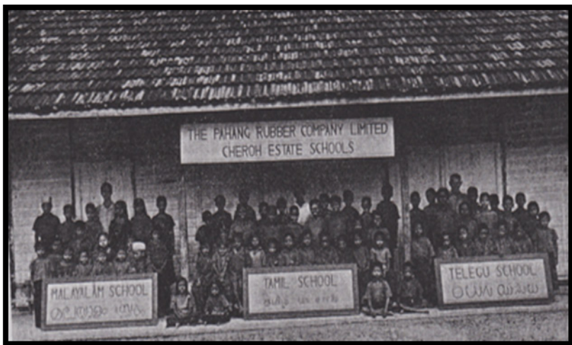
Rajah 2 Sekolah ladang yang dibahagikan kepada tiga buah kelas iaitu Tamil, Malayalam dan Telugu

Tamil, sekolah Malayalam dan sekolah Telugu. Pada awalnya, dua atau tiga jenis sekolah telah wujud di kawasan perladangan iaitu sekolah Tamil, Malayalam atau Telugu secara berasingan atau ketiga-tiga jenis sekolah di bawah satu bumbung tetapi beroperasi secara berasingan mengikut pecahan kaum seperti kaum Tamil, Malayalee dan Telugu. Keadaan ini wujud hampir di kebanyakan ladang di Tanah Melayu sebelum merdeka. Hal ini demikian kerana British ingin memecah perintah subetnik di Tanah Melayu dari segi tempat tinggal, tempat kerja, kasta, gaji, kuil, pembahagian kerja dan termasuklah sekolah. Dalam hal ini, 90 peratus buruh India di Tanah Melayu terdiri daripada buruh berketurunan Tamil. Selebihnya terdiri daripada orang Malayalee, Telugu dan orang India Utara, iaitu orang Punjabi dan Gujerati serta Sikh. Namun, British ingin mengecilkan lagi kaum India mengikut kelompok kerana tidak mahu wujud perpaduan dan hubungan yang erat dalam kalangan masyarakat India dan hal ini tidak akan menyenangkan pentadbiran British. Maka, jelaslah bahawa sekolah Tamil di ladang bukan untuk kemajuan komuniti India, malah ia adalah semata-mata untuk tujuan ekonomi British, iaitu sebagai salah satu kemudahan yang paling asas bagi mengekalkan buruh dan bekerja secara berterusan di bawah pihak kolonial. Pecahan kaum India di sekolah dapat dilihat secara jelas dalam Rajah 2.