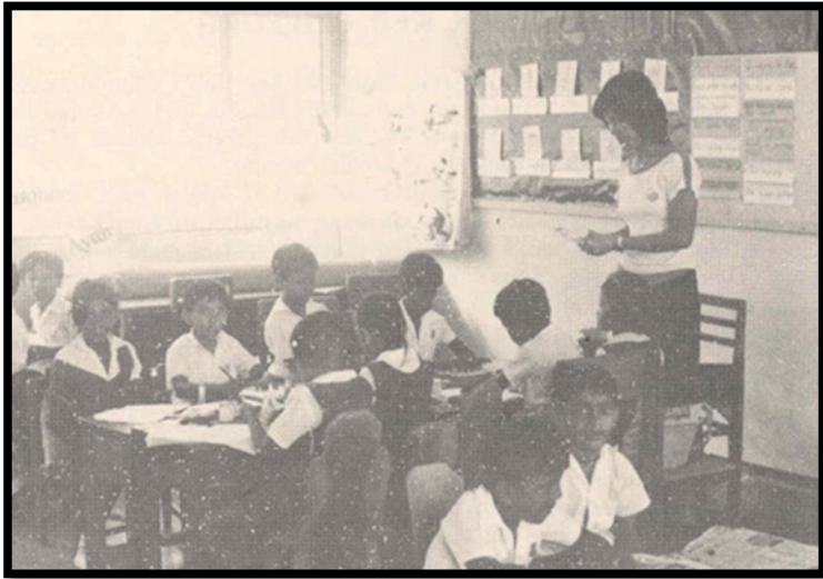
Rajah 4 Salah sebuah sekolah semasa era pendudukan Jepun di Tanah Melayu