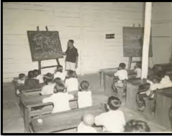
Rajah 1 Keadaan sekolah Tamil pada tahun 1912 di Tanah Melayu

pendidikan agak ketinggalan berbanding dengan sekolah vernakular lain di Tanah Melayu. Rajah 1 menunjukkan kondisi sekolah Tamil pada tahun 1912 di Tanah Melayu.