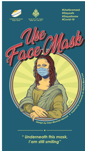
Gambar 1 Intan Munirah Hamzah, Use Face Mask , 2020, Poster Digital

Karya bertajuk Use Face Mask ini merupakan salah satu dari siri poster COVID-19 oleh BSLs yang dimuat naik dalam media sosial pada minggu kedua PKP diperkenalkan. Ia menggambarkan potret seorang perempuan iaitu Monalisa yang merupakan sosok figura ikonik dari karya catan pelukis tersohor Itali iaitu Leonardo Da Vinci. Unsur visual tersebut telah dipinjam oleh Intan melalui manipulasi digital terhadap bentuk, kesan jalinan dan juga warna yang pada dasarnya disederhanakan olehnya sehingga cenderung berubah dari gaya pengucapan asalnya yang bersifat realistik kepada gaya pengucapan yang bersifat ilustrasi komik. Bukan itu sahaja, peminjaman tersebut bukanlah secara melulu, bahkan Intan juga menghadirkan perbezaan yang jelas pada potret tersebut dengan membuat perubahan pada wajah Monalisa yang dipakaikan dengan topeng muka yang menutup bahagian atas hidung sehingga ke bawah dagu.