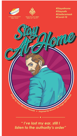
Gambar 2 Intan Munirah Hamzah, Vincent Stay At Home , 2020, Poster Digital

Karya poster kedua dari siri poster COVID-19 dari BSLs yang bertajuk Stay At Home ini memperlihatkan gambaran potret seorang lelaki separuh tubuh dari pandangan belakang tetapi wajahnya dipalingkan ke arah sisi sebelah kiri bidang komposisi. Berdasarkan judul karya dan juga ciri yang tampil pada wajahnya yang berambut keperangan dan juga memiliki jambang yang lebat, sosok lelaki ini merupakan representasi dari Vincent van Gogh, seorang pelukis kelahiran Belanda yang begitu terkenal dengan karya-karya potret diri dan landskap dengan gaya Pasca Impresionisme yang dicirikan melalui sapuan warna-warna buram, garisan berat dan ilusi pergerakan udara dan juga cahaya.