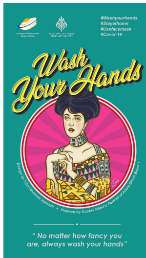
Gambar 3 Intan Munirah Hamzah, Wash Your Hands , 2020, Poster Digital

Karya poster terakhir dari siri poster COVID-19 dari BSLS yang bertajuk Wash Your Hands ini menggambarkan potret seorang perempuan dalam pandangan hadapan dari bahagian pinggang ke atas. Berdasarkan informasi yang tertulis pada karya poster ini, gambaran subjek tokoh tersebut merupakan seorang perempuan bernama Adele Bloch-Bauer 1, seorang hartawan berbangsa Yahudi dan juga merupakan isteri kepada Ferdinand Bloch-Bauer yang merupakan ahli bank dan juga pengilang gula terkenal di Vienna, Austria pada awal abad ke-20. Sosok perempuan ini pernah diabadikan oleh Gustav Klimt dalam sebuah karya catan bertajuk Portrait of