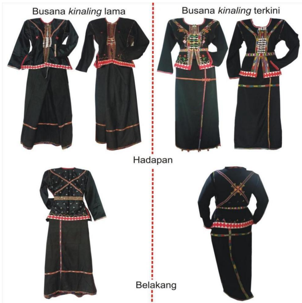
Foto 5 Perbezaan busana kinaling yang dipasangkan dengan tapi tanpa aksesori

Sabung kinaling dipadankan dengan skirt (tapi) berwarna hitam bercorak ringkas yang panjang menutupi buku lali ( tampangil ). Ragam hias tapi lama dan tapi moden adalah sangat berbeza dari segi susun atur corak. Sehelai tapi lama yang telah mencecah usia lebih daripada 60 tahun mempunyai hiasan horizontal pada bahagian pertengahan betis (Foto 5). Hiasan horizontal berkenaan diubah kedudukan iaitu diletakkan pada pertengahan bahagian paha pemakai (pada masa sekarang) bagi mengelakkan tapi kelihatan kosong jika dipakai tanpa aksesori terutamanya aksesori pada bahagian pinggang iaitu sinogoloi (Ayunan Pangi, 2022). Pertemuan hiasan vertikal dan horizontal biasanya ditambah dengan motif bunga atau spiral (paku pakis). Pada bahagian bawah kain pula, giring (lonceng tembaga kecil) digantung sebagai hiasan dan memberikan kemeriahan dan keceriaan kepada si pemakai dan masyarakat disekelilingnya. Kelebihan tapi moden adalah mudah dipakai dan lebih kukuh kerana penggunaan zip dan cangkuk pada bahagian pinggang (Foto 6).