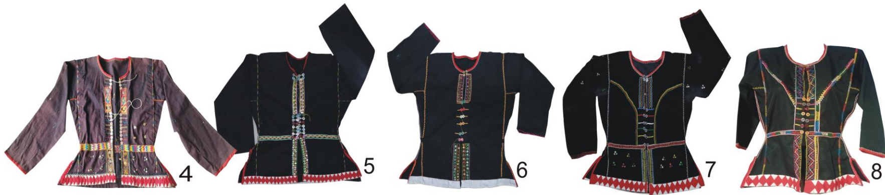
Kinaling berusia lebih dari 20 tahun