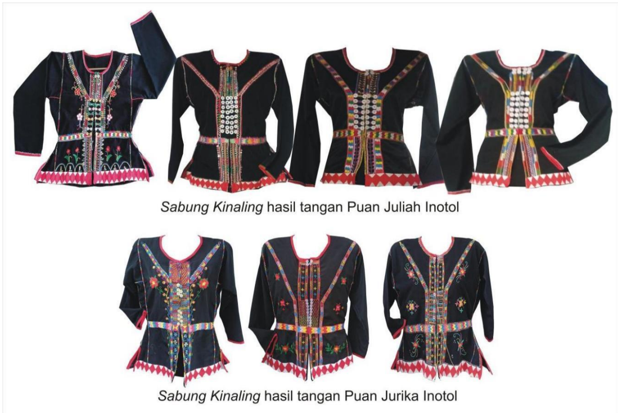
Foto 2 Antara Sabung kinaling masa kini