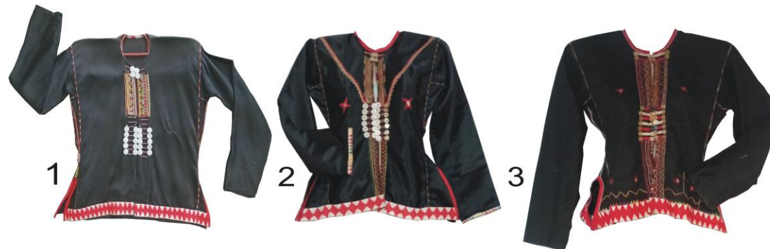
Kinaling berusia lebih daripada 70 tahun