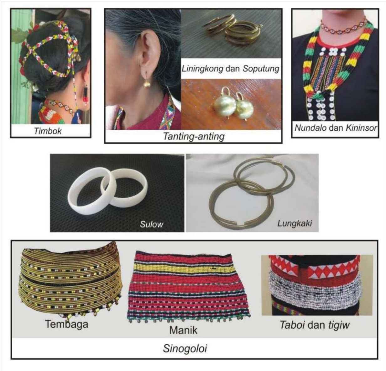
Foto 3 Gambar aksesori tambahan busana kinaling