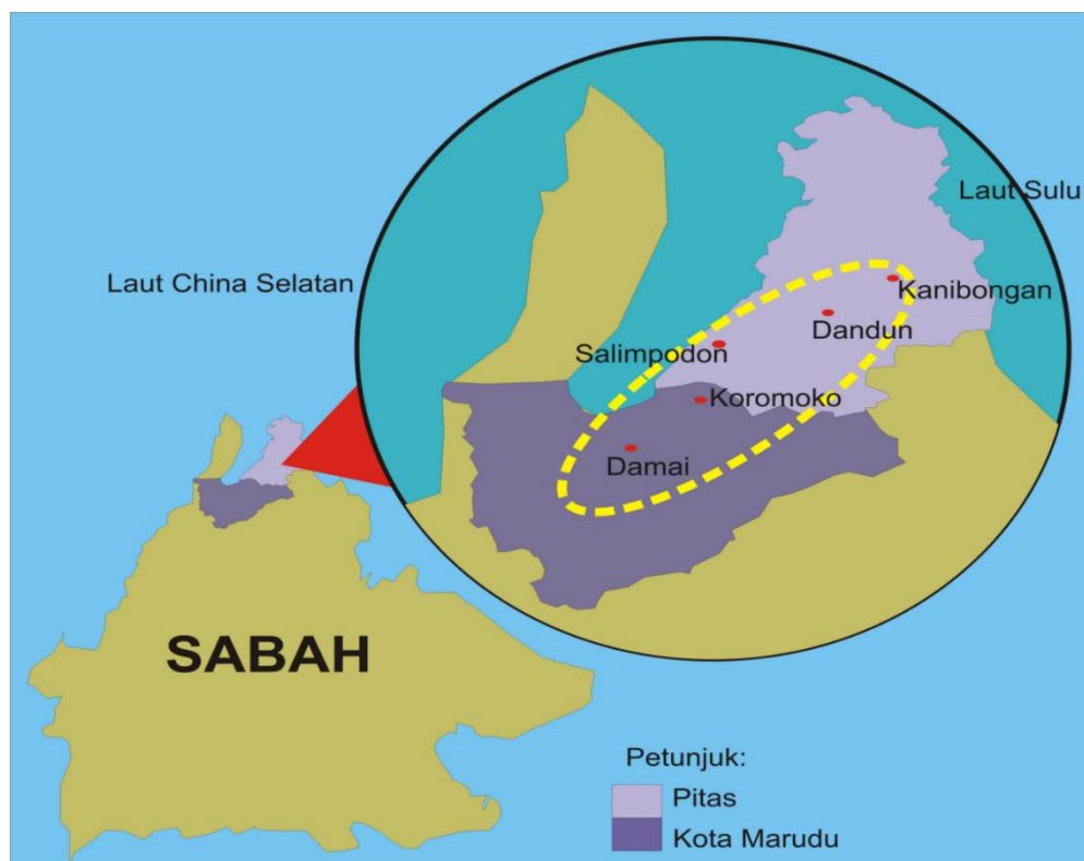
Peta 1 Kawasan petempatan masyarakat Dusun Kimaragang

Berkaitan dengan kajian busana tradisi di Sabah, para pengkaji lebih berminat meneliti kesenian dan ragam hiasan terhadap busana seperti pakaian tradisi Suang Lotud, Rungus, Murut dan Kadazan Penampang (Jusilin & Kindoyop, 2016; Yoon, 2018; Juslin, Ismail Ibrahim & Teou, 2019; Ezura et.al , 2022). Namun, perbincangan berkenaan dengan motif dan ragam hias sabung kinaling hanya dikaji secara sepintas lalu (Pangayan, 2014; 2017; 242-246; Pangayan & Shafii, 2020). Kekurangan kajian dan pendokumentasian menyebabkan masyarakat tidak mendapat maklumat yang cukup berkaitan dengan sabung kinaling . Maka dengan adanya makalah seumpama ini diharapkan dapat memberikan data dan maklumat kepada masyarakat dan sebagai rujukan para penyelidik serta golongan sarjana.