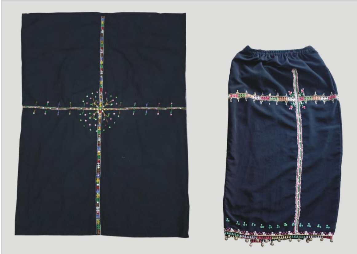
Foto 6 Perbezaan tapi dahulu dan sekarang

Pemilihan aksesori tambahan dalam pemakaian sabung kinaling adalah bergantung kepada taraf ekonomi si pemakai. Jika seseorang tersebut berkemampuan dari segi ekonomi maka aksesori pilihan adalah berasaskan logam dan jika kurang berkemampuan pemilihan aksesori daripada bahan organik (tumbuhan) (Juliah Inotol, 2022). Walau demikian, dewasa kini, pemilihan aksesori tidak lagi ditentukan oleh taraf ekonomi masyarakat tetapi berdasarkan kebolehcapaian terhadap aksesori berkenaan. Kekurangan golongan yang pandai dalam menghasilkan aksesori berasaskan logam adalah penyebab utama masyarakat mengambil inisiatif lain seperti menggunakan manik sebagai perhiasan.