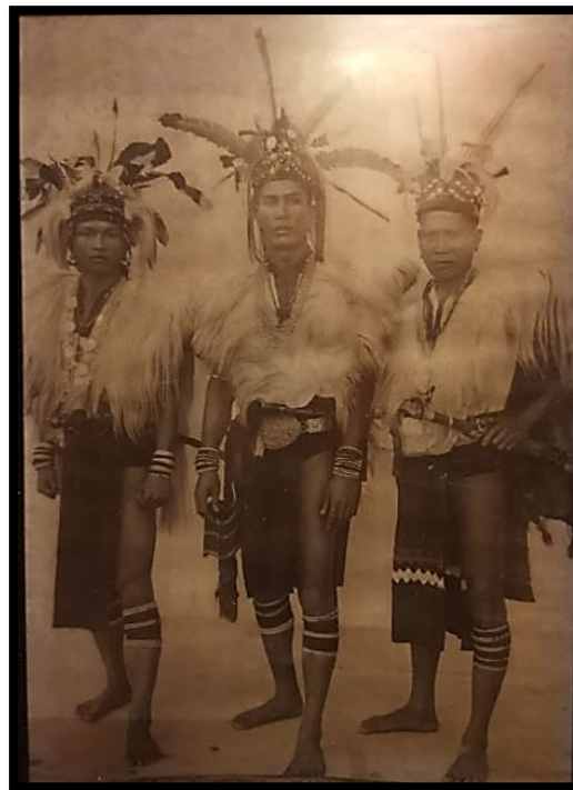
Rajah 3: Busana lelaki Iban yang lengkap dengan parang Ilang

Iban terdahulu mempunyai kearifan tradisi dalam aspek melindungi diri terhadap ancaman dan serangan pihak musuh serta binatang buas. Parang Ilang dalam Rajah 3 adalah merupakan salah satu logistik perang yang digunakan oleh pahlawan Iban dalam ekspedisi tradisi Ngayau atau aktiviti pemburuan kepala manusia. Menurut Beji Anak Laga (2023), dalam budaya Iban, keturunan Bujang Berani sememangnya sangat terkenal dengan sifat kepahlawanan yang tinggi melalui ekspedisi tradisi Ngayau sebagai simbol kuasa dan ikon keberanian. Ekspedisi tradisi Ngayau sangat sinonim dengan golongan lelaki Iban. Individu yang mempunyai teknik peperangan yang efektif akan dilantik menjadi ketua, disanjung dan digeruni oleh individu lain. Berdasarkan kepada tradisi lisan generasi Iban terdahulu, tujuan mereka berperang adalah untuk mendapatkan harta kekayaan dan status sosial, iaitu berdasarkan jumlah kepala musuh yang diperoleh semasa ekspedisi tradisi Ngayau .