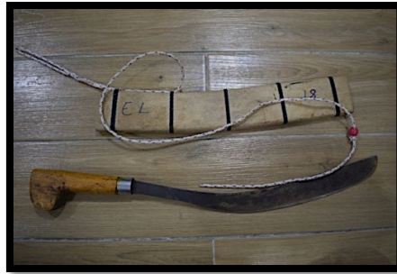
Rajah 1: Parang Tangkin

Dalam budaya Iban, menurut Adilawati Asri (2024), parang Ilang adalah merupakan salah satu senjata tradisi. Parang Ilang juga sememangnya digunakan dalam kebudayaan Iban, tetapi pada asalnya adalah disebabkan oleh perkembangan ilmu persenjataan oleh Kayan dan Kenyah. Bagi Kayan dan Kenyah, mereka mempunyai pelbagai jenis parang. Manakala, Iban juga mempunyai parang lain sebelum wujudnya parang Ilang , seperti parang Tangkin dalam Rajah 1 dan parang penebas pada Rajah 2. Parang penebas ini lebih panjang berbanding parang Tangkin yang agak pendek.