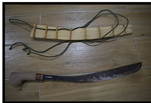
Rajah 2: Parang Penebas Yang Tidak Mempunyai Kilas.