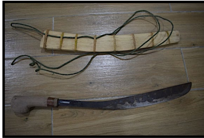
Rajah 2: Parang Penebas Yang Tidak Mempunyai Kilas