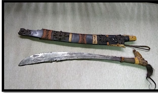
Rajah 4: Parang Ilang Iban yang berusia ratusan tahun sebagai pusaka Iban.