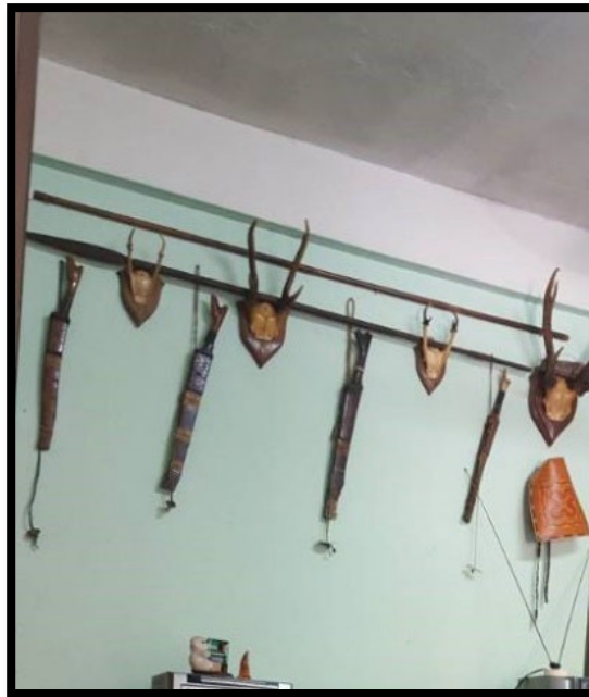
Rajah 5: Koleksi Parang Ilang Milik Nelson Anak Antau

Dalam adat Iban sepertimana yang diterangkan oleh Dato Sri Edmmund Langgu (2023), Parang Ilang juga tidak boleh dilempar, dicampak serta diletakkan pada sembarangan tempat dan lazimnya ia digantung pada ruangan tinggi sepertimana dalam Rajah 5. Memandangkan parang Ilang ini adalah merupakan salah satu senjata tajam dan ampuh, maka ia perlu diurus dan dijaga dengan baik melalui digantung pada dinding dan disimpan pada tempat yang tersembunyi serta dijauhi daripada golongan kanak-kanak. Ini kerana ia bertujuan bagi mengelakkan sebarang kecederaan yang berlaku. Tambahan pula, bagi sesetengah parang Ilang yang sudah lama usianya, maka dikatakan bahawa sekiranya terdapat seseorang yang terkena libasan bilahnya akan menyebabkan kecederaan yang agak sukar untuk sembuh. Ini kerana besi seni parang Ilang yang sudah terlalu lama akan menyebabkan luka terkena bilahnya dan ia agak sukar untuk sembuh dengan cepat.