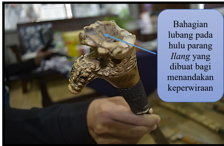
Rajah 7: Lubang Atas Pada Parang Ilang Yang Dicipta Bagi Menandakan Keperwiraan Dengan Membawa Pulang Kepala Pihak Musuh Serta Rambutnya Diikat Pada Bahagian Tersebut.