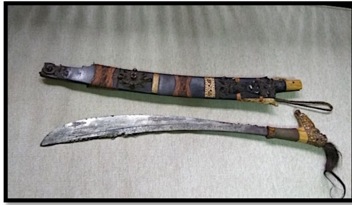
Rajah 4: Parang Ilang Iban yang berusia ratusan tahun sebagai pusaka Iban