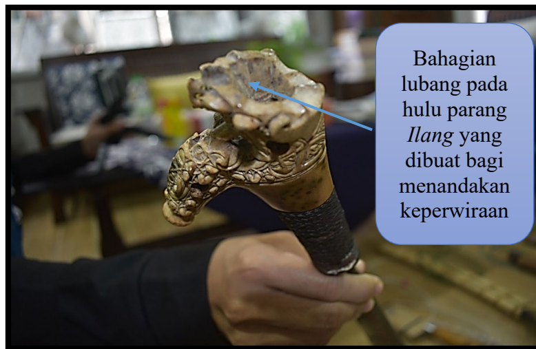
Rajah 7: Lubang Atas Pada Parang Ilang Yang Dicipta Bagi Menandakan Keperwiraan Dengan Membawa Pulang Kepala Pihak Musuh Serta Rambutnya Diikat Pada Bahagian Tersebut.