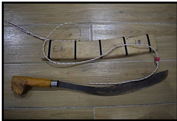
Rajah 1: Parang Tangkin

Dalam budaya Iban, menurut Adilawati Asri (2024), parang Ilang adalah merupakan salah satu senjata tradisi. Parang Ilang juga sememangnya digunakan dalam kebudayaan Iban, tetapi pada asalnya adalah disebabkan oleh perkembangan ilmu persenjataan oleh Kayan dan Kenyah. Bagi Kayan dan Kenyah, mereka mempunyai pelbagai jenis parang. Manakala, Iban juga mempunyai parang lain sebelum wujudnya parang Ilang , seperti parang Tangkin dalam Rajah 1 dan parang penebas pada Rajah 2. Parang penebas ini lebih panjang berbanding parang Tangkin yang agak pendek.