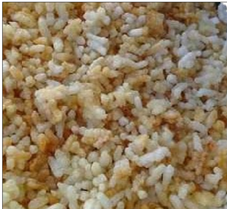
Gambar 6: Kertob.

Bertih beras atau dikenali sebagai kertob merupakan elemen penting di atas pakar atau dulang hantaran Serarang . Kertob biasanya menggunakan lebih nasi yang telah dijemur terlebih dahulu. Nasi yang telah kering setelah dijemur digoreng dan diadun menggunakan gula apong. Masyarakat Melanau Likow percaya bahawa kertob menyucikan diri dan menghalau elemen jahat di sekeliling mereka. Selain itu, kertob yang telah digoreng merujuk kepada maksud kesuburan hidup dalam masyarakat Melanau Likow . Mereka percaya bahawa beras membawa simbol yang suci dan lebih nasi tidak harus dibuang begitu saja. Oleh itu, perasaan yang suci dan bersih dapat menghindari daripada perasaan negatif terhadap orang lain. Bagi masyarakat Melanau Likow , kertob adalah lambang kesyukuran dan tanda terima kasih atas rezeki yang mencukupi daripada Ipok .