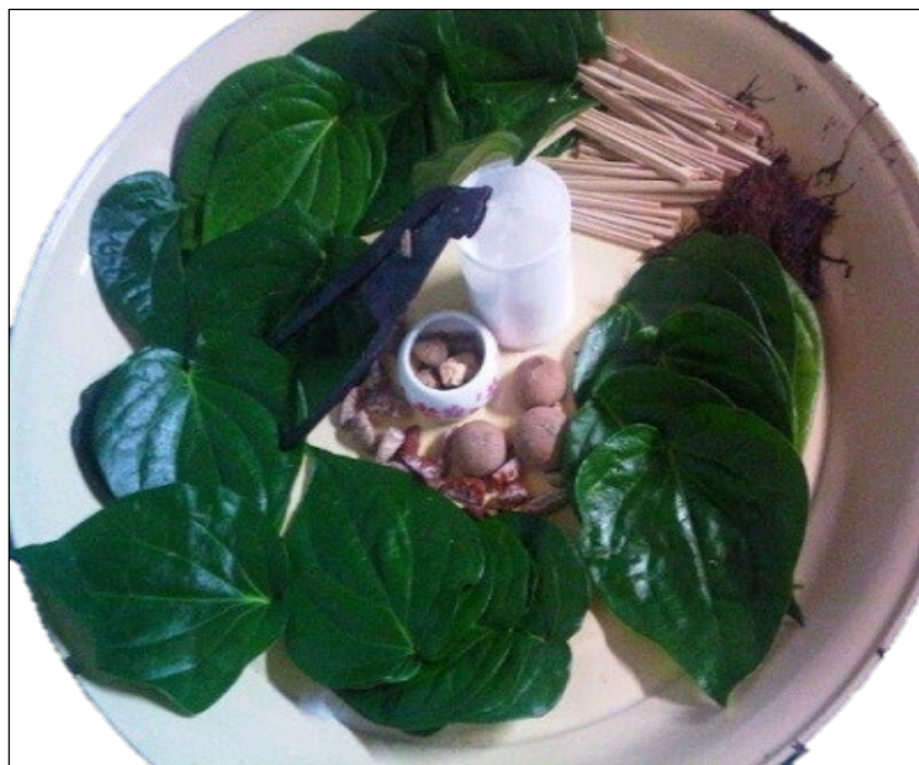
Gambar 7: Belen.

masyarakat Melanau Likow merupakan bentuk makanan yang sama seperti dikatakan oleh Geertz (1973). Bezanya hanyalah jenis barangan yang disediakan sebagai belen . Sebagai contoh, masyarakat Mojukuto menggunakan sikat rambut, benang, bunga, kemenyan, buah pinang, tembakau dan sebagainya. Masyarakat Melanau Likow pula menggunakan sajian seperti sirih, tembakau dan rokok apung. Berdasarkan kepada kedua-dua keadaan itu, meunjukkan bahawa belen yang disediakan kerana maksud yang tersendiri. Penyediaan belen dikhususkan untuk jamuan kepada makhluk ghaib yang dipercayai akan menjaga atau membantu kehidupan mereka. Amalan penyediaan belen dalam masyarakat Melanau Likow bukan sahaja untuk Ipok namun sering kali dijadikan makanan untuk orang-orang tua pada hari biasa atau semasa kematian.