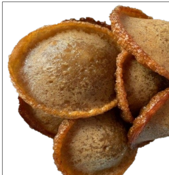
Gambar 2: Kuih Penyaram.