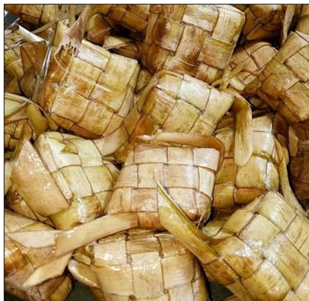
Gambar 4: Apit lepas

Ketupat atau apit lepas dalam kehidupan tradisi masyarakat Melanau Likow membawa makna yang tersendiri. Mereka percaya bahawa ritual Serarang tidak lengkap sekiranya tidak meletakkan apit lepas di dalam dulang hantaran Serarang . Apit lepas yang diperbuat daripada beras pulut dan dibalut menggunakan daun nipah muda atau daun medok . Berdasarkan kehidupan generasi terdahulu, sebelum memulakan perjalanan ke sungai dan laut, apit lepas