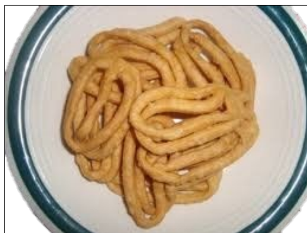
Gambar 5: Kuih perut ayam.

Kuih perut ayam merupakan sajian tradisional masyarakat Melanau Likow yang wajib dipersembahkan dalam hampir setiap upacara dan perayaan yang melibatkan hal kematian mahupun sambutan awal tahun. Dalam tradisi masyarakat Melanau Likow , kuih perut ayam diperbuat daripada doh tepung gandum, santan, marjerin dan gula. Setelah diadun kesemua bahan, doh tersebut dicanai dan dipotong secara memanjang. Kemudian, doh yang telah dipotong digulung untuk mendapatkan bentuk seperti perut ayam. Setelah gulungan tersebut diperolehi, ia digoreng sehingga kekuningan. Kuih ini melambangkan kemakmuran dan keharmonian hidup masyarakat Melanau Likow . Simboliknya dapat dilihat melalui bentuknya yang bersifat melingkari dan bertindih antara satu sama lain. Bentuknya yang seperti perut ayam serta tekstur rasa yang rapuh itu merujuk kepada kehidupan masyarakat Melanau Likow yang saling memerlukan dan bertoleransi demi kedamaian dalam kehidupan. Kemakmuran hidup dan keharmonian ikatan kekeluargaan dipaparkan melalui struktur bentuknya yang bertindih antara satu sama lain.