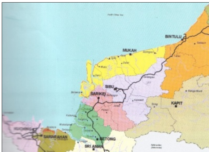
Rajah 1: Peta negeri Sarawak, Daerah kajian di Mukah