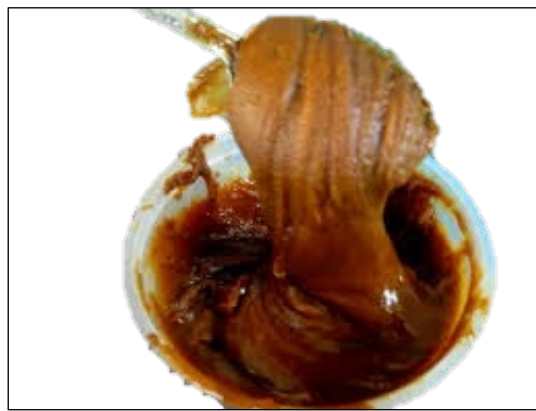
Gambar 1: Gula apong

Penyaram mempunyai rasa manis yang asli hasil daripada gula apong. Informan menjelaskan rasa manis daripada penyaram melambangkan kasih sayang. Masyarakat Melanau Likow percaya bahawa penyaram mampu merapatkan hubungan keluarga yang terpisah jauh. Hal ini kerana ritual Serarang menghimpunkan seluruh ahli keluarga dan rakan taulan yang berjauhan, balik ke kampung dan meraikan pesta Kaul. Lingkaran seperti tali yang dibentuk di sekeliling penyaram pula merujuk kepada ikatan kasih sayang dalam masyarakat Melanau Likow yang tidak pernah terputus.