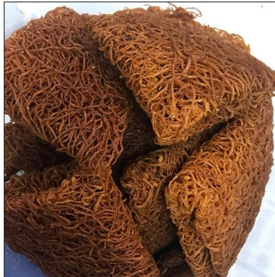
Gambar 3: Kuih jala.

Kuih jala ialah simbol doa dan harapan dalam tradisi ritual masyarakat Melanau Likow . Kuih ini menjadi elemen penting dalam pakar atau dulang hantaran sebagai salah satu makanan kegemaran Ipok . Kuih jala merujuk kepada simbol doa dan pengharapan agar pekerjaan sama ada hasil sungai atau laut bertambah pada tahun semasa dan akan datang. Masyarakat Melanau Likow mengharapkan keuntungan yang lebih banyak `di sebalik pelaksanaan ritual ini.