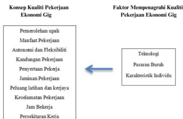
Rajah 1: Adatptasi kerangka konseptual kualiti pekerjaan ekonomi gig dan faktor mempengaruhinya