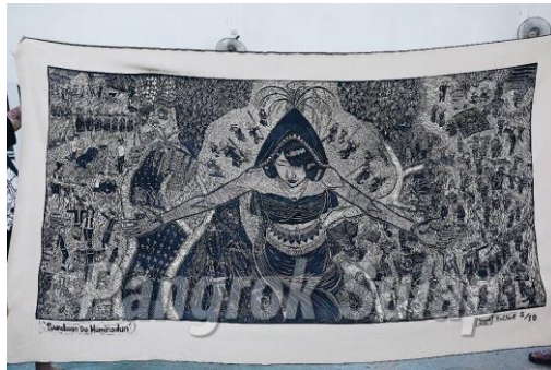
Gambar 9: Karya seni cetakan kayu di atas kanvas oleh kolektif Pangrok Sulap

Oleh kerana karya seni cetakan kayu mereka dicetak dalam skala ukuran yang kecil, jadi tidak hairanlah mengapa visualisasi dan komposisi yang ditampilkan cukup sederhana, ringkas dan longgar. Ini sama sekali berbeza jika dibandingkan dengan karya-karya seni cetakan kayu dalam format konvensional di mana visualisasinya kelihatan lebih rumit, terperinci dan padat seperti yang dapat dilihat pada gambar di atas. Akan tetapi, kesederhanaan, keringkasan serta kelonggaran dalam aspek visual dan komposisi itulah sebenarnya menjadi kekuatan seni poster sehingga makna yang disampaikan lebih tegas dan mudah untuk difahami ketika diapresiasi oleh masyarakat.