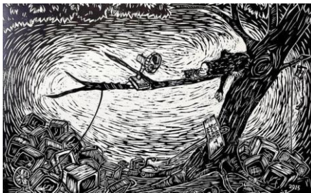
Gambar 1: Jungle of Hope (2015) Cetakan dakwat di atas kertas

Lingkungan alam sekitar tempat manusia berinteraksi dan juga memenuhi segala keperluan hidupnya sentiasa mengalami perubahan. Salah satu fenomena perubahan alam sekitar yang begitu menonjol di Sabah bukanlah disebabkan oleh bencana alam tetapi sebaliknya disebabkan oleh tindakan manusia sendiri seperti aktiviti pembangunan, aktiviti pembuangan sampah sarap secara terbuka, aktiviti pembalakan dan sebagainya.