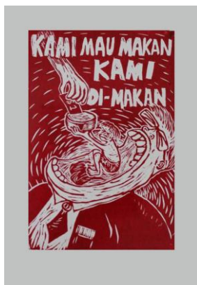
Gambar 10: Kami Mau Makan Kami Di-Makan (2014) Cetakan dakwat di atas kertas

Oleh kerana karya seni cetakan kayu mereka dicetak dalam skala ukuran yang kecil, jadi tidak hairanlah mengapa visualisasi dan komposisi yang ditampilkan cukup sederhana, ringkas dan longgar. Ini sama sekali berbeza jika dibandingkan dengan karya-karya seni cetakan kayu dalam format konvensional di mana visualisasinya kelihatan lebih rumit, terperinci dan padat seperti yang dapat dilihat pada gambar di atas. Akan tetapi, kesederhanaan, keringkasan serta kelonggaran dalam aspek visual dan komposisi itulah sebenarnya menjadi kekuatan seni poster sehingga makna yang disampaikan lebih tegas dan mudah untuk difahami ketika diapresiasi oleh masyarakat.