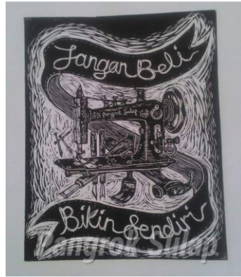
Gambar 5: Kalau Mau Bangsa Maju Belilah Sigup Nenek! (2016) Cetakan dakwat di atas kertas