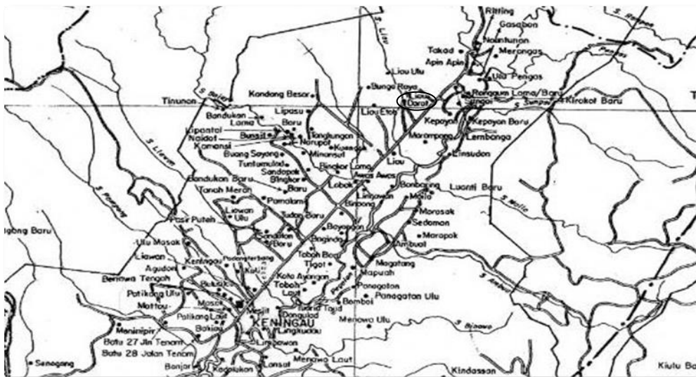
Peta 2: Lokasi Kampung Liau Darat