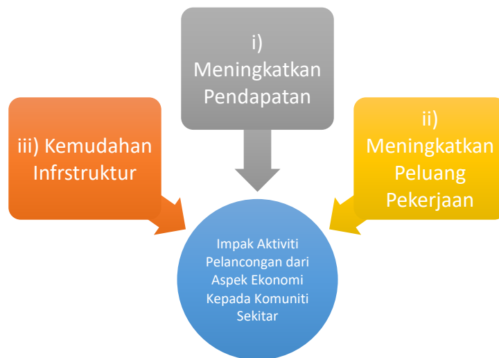
Rajah 3: Impak Aktiviti Pelancongan dari aspek Ekonomi.

Tanjung Simpang Mengayau, Kudat. Kebanyakan ahli komuniti setempat ini berjaya melibatkan diri dalam aktiviti pelancongan yang diusahakan tersebut (Penolong Pegawai Pembangunan Pelancongan Daerah, Kudat, Mei, 2021). Berikut merupakan impak positif yang diterima oleh komuniti setempat di kawasan kajian hasil daripada temubual bersama informan dalam kajian ini.