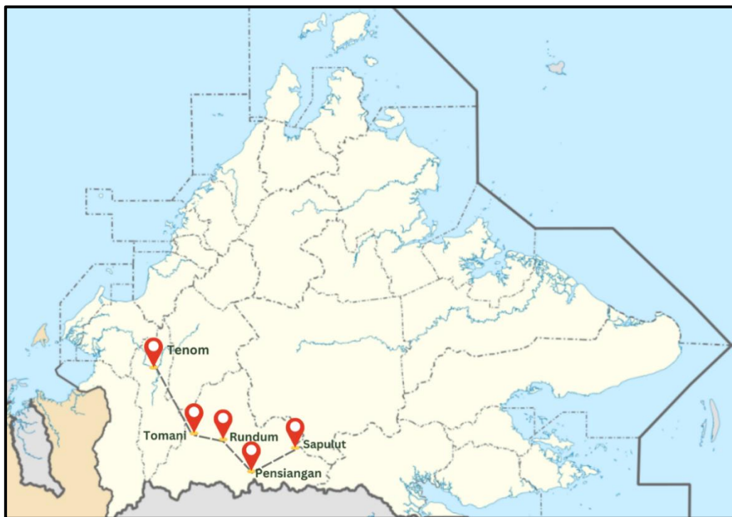
Jadual 1: Kawasan penempatan masyarakat Murut Tahol di Sabah, Kota Kinabalu